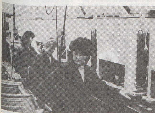
V proizvodnji zamrzovalnih skrinj se resnično lahko ponašajo z urejenostjo delovnih mest