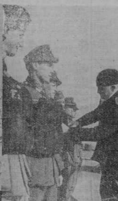
Nemške čete na potu na Norveško. Vojaštvo, katero je bilo ukrcano, so poučili glede rabe rešilnih pasov