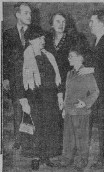
Na sliki vidimo ženo, hčerko in vnuke najslavnijšega ameriškega iznajditelja rajnega Tom. Edisona