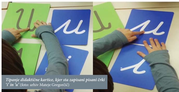
Tipanje didaktične kartice, kjer sta zapisani pisani črki 'i' in 'u'