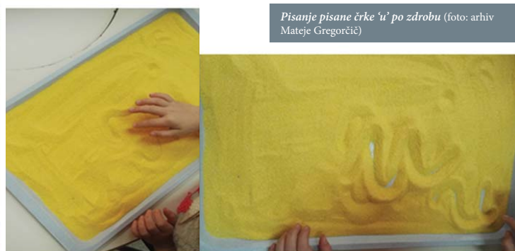
Pisanje pisane črke 'u' po zdrobu