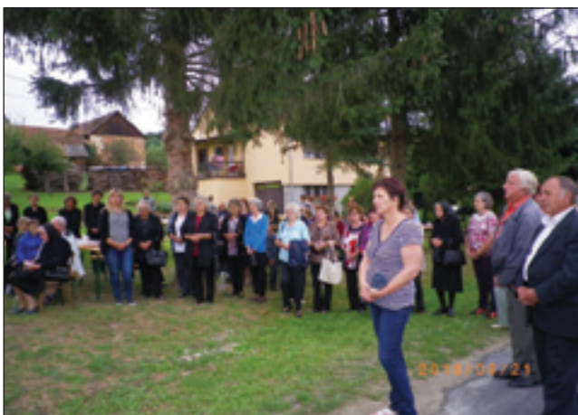
Verniki so se zbrali v lepem številu

z velikim navdušenjem čakali izredni dogodek, namreč v tem letu je bila kapelica popolnoma obnovljena in zato tudi slovesno blagoslovljena. Obnovitev kapelice je bila že vrsto let načrtovana, vendar zmeraj preložena na