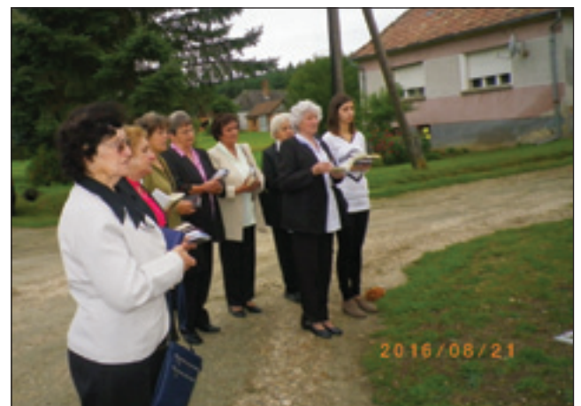
Pri litanijah so pele števanovske ženske

vas in ohranjanje tradicije je od lanskega leta sprotno koordiniralo dela, velikokrat organiziralo prostovoljno delo, tako so člani društva sami odstranili beton okrog kapelice, zagotovili ustrezno odvajanje vode, položili tla-