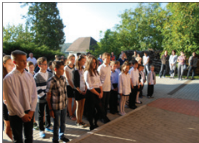
Na števanovski šauli je začnilo nauvo šaulsko leto 49 šaularov