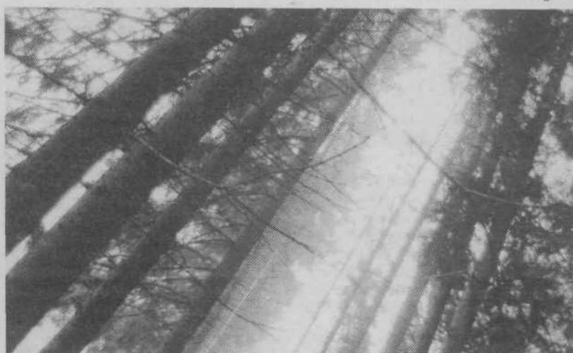
Dušan Jež: »V GOZDU II.«