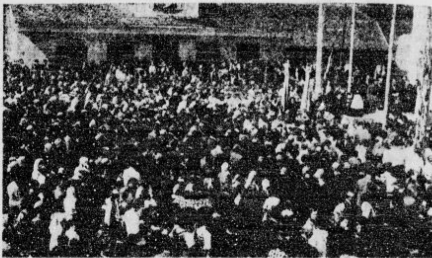
Prizor s kmetkega tabora v Zagorju, ki so se ga udeležili tisoči kmetkega ljudstva.