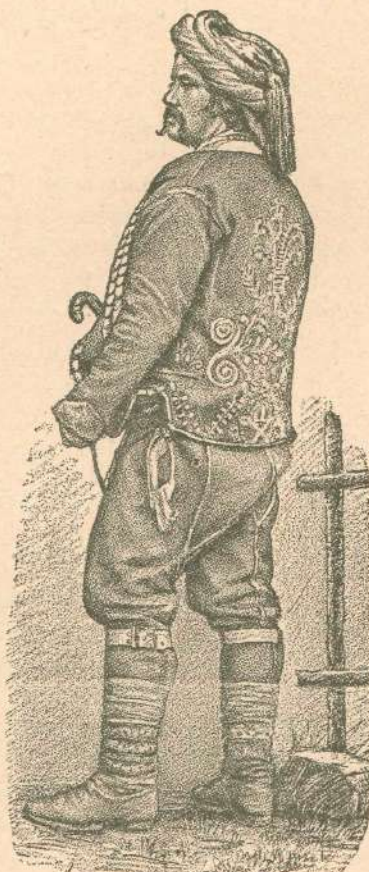
2. Morlak — Imoščan.