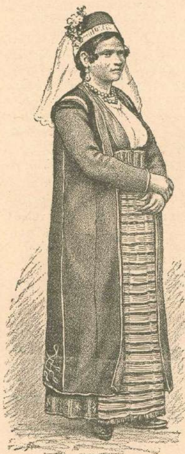
1. Morlakinja — Imoščanka.

dem fehlt die Absicht. Mit Absicht handeln, ist das, was den Menschen über geringere Geschöpfe erhebt; mit Absicht dichten, mit Absicht nachahmen, ist das, was das Genie von den kleinen Künstlern unterscheidet, die nur dichten, um zu dichten, die nur nachahmen, um nachzuahmen . . . Mit dergleichen Nachahmungen fängt das Genie an, zu lernen,