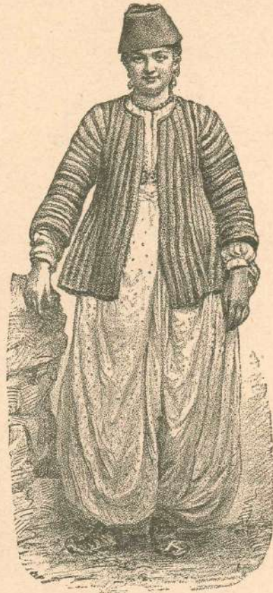
6. Srbkinja iz Serajeva.

v svojih umotvorih samo na to ozira; realist torej ne pozna in ne prizna lepote, ki se kaže pri bitjih obdarovanih s spoznanjem in svobodno voljo. Umetnik-realist načelno v svojih umotvorih ne kaže nič lepega, nič velikega, kar bi segalo v nadnatorni red; on kaže samo vidne, lepe stvari in pojave in sicer pri tem nima namena, našim očem predstavljati kaj duševno lepega; užitek napravlja realist s tem, da nam kaže popolno nove, redke, grozne, smešne pri-