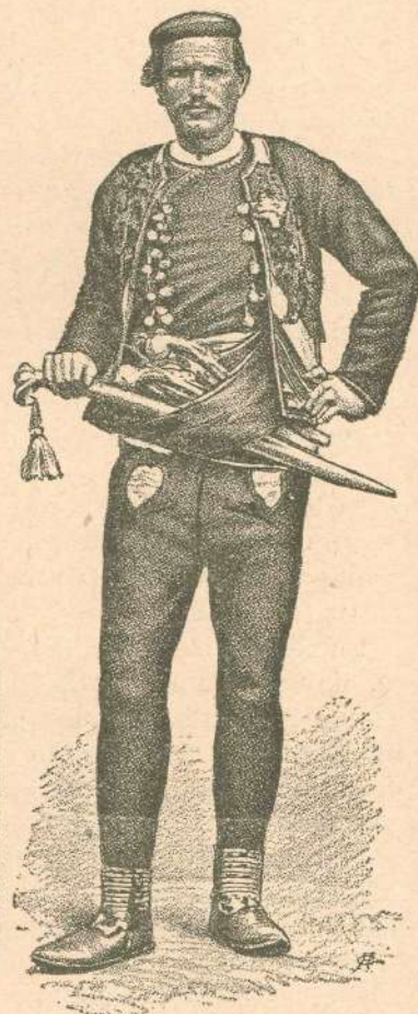
3. Kmet iz okolice šibeniške.

es sind seine Vorübungen . . . allein mit der Anlage und Ausbildung seiner Hauptcharaktere verbindet es weitere und grössere Absichten: die Absicht, uns zu unterrichten, was wir zu thun oder zu lassen haben; die Absicht, uns mit den eigentlichen Merkmalen des Guten und des Bösen, des Anständigen und Lächerlichen bekannt zu machen; die Absicht, uns jenes in allen seinen Verbindungen und Folgen als schön und als glücklich selbst im Unglück, dieses dagegen als