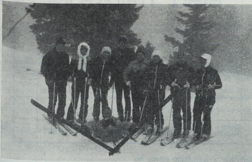
Udeleženci tečaja na Krvavcu

Lepo je bilo, k sreči pa še brez poškodb!