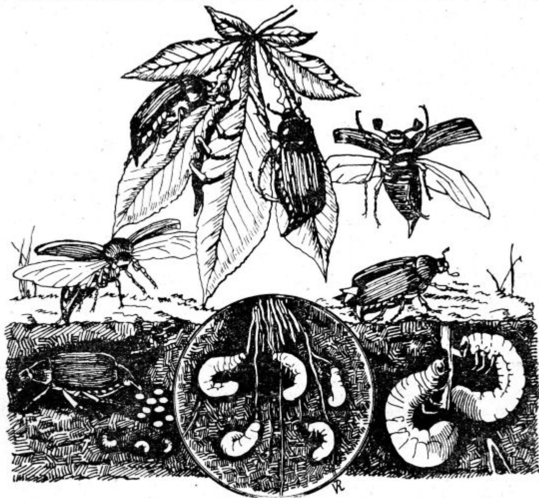
Pod. 13. Razvoj in življenje hrošča in črva.

polju in kraj gozdov. Kjer jih je največ, tam jih je najbolj preganjati in uničevati. Vsa županstva, vse šole, vse kmetijske organizacije in sploh vsi kmetovalci morajo pomagati! Pri županstvih naj se nastavijo zaupniki, da organizirajo in nadzorujejo pokončevanje hrošča. Šolski otroci naj se oprostijo puka in naj se razdele na partije, da pod nadzorstvom svojih učiteljev in drugih pripravnih zaupnikov nabirajo hrošče. Zavedni gospodarji naj jih porabijo