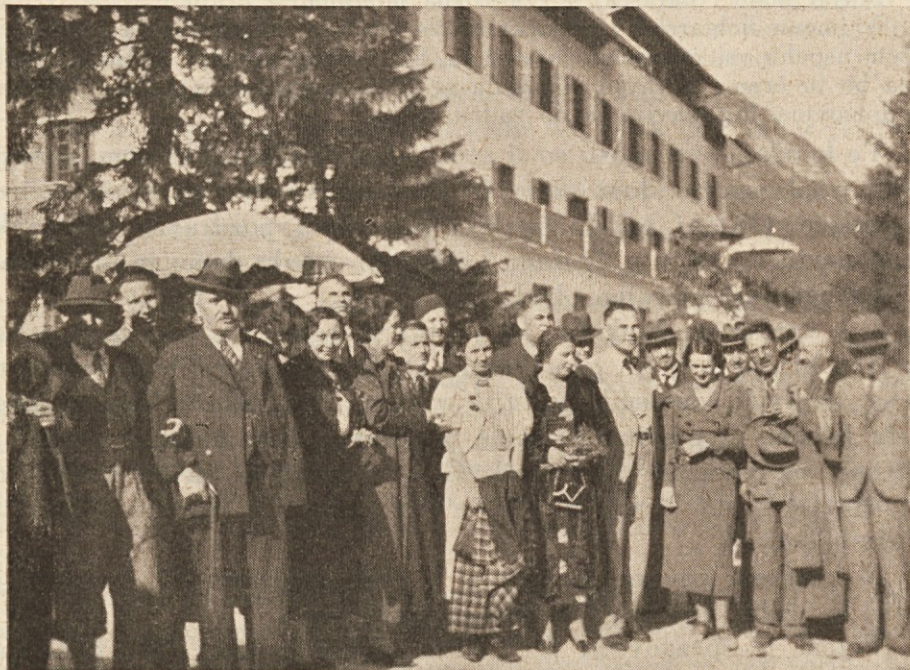
Pred Zvezinim domom.

„V veličastnem miru, sredi mogočnih gorá je ustvarila vzajemna moč svoje veliko, lepo in plemenito delo. Razmeroma kratka, ali bogata je delavnost vaše Zveze. Danes slavi ta delavnost svoj triumf. Povsod, kjer je solidarnost v srcu ljudstva pognala globoke korenine, cvete in napreduje zadruništvo. Solidarnost pomenja duhovno skupnost, duševno edin-