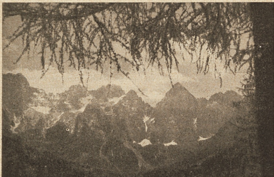
Pogled na Martuljkovo skupino iz Mladinskega doma.