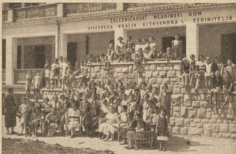
Ženska deca pred Mladinskim domom.