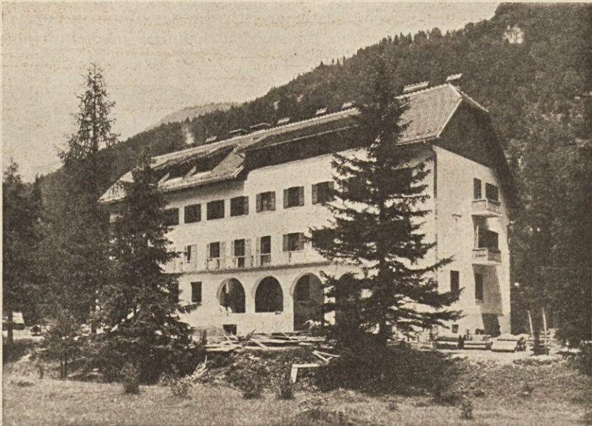
Zvezin dom „Mihaela Vošnjaka“ v Martuljku.