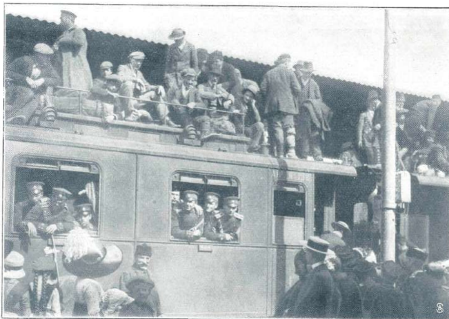
BOLGARSKI VOJAŠKI NOVINCI.

prvo lakoto v Rusiji, potem pa še v nekaterih krajih Ogrske in Galicije, vobče pa draginjo. — Popravljali so farno cerkev v Kranju. — Jesen je bila mila in do konca leta nič snega. Mraz tako neznamen, da zemlja ni nikoli trdno zamrznila.