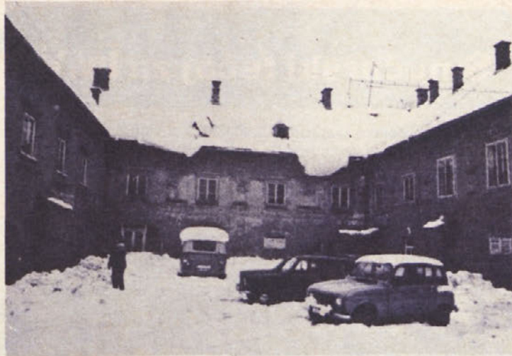
Grajsko dvorišče, ki ni prav nič „grajsko“. S streh se usipa sneg in sem in tja poškodeje tudi nova vozila . . .