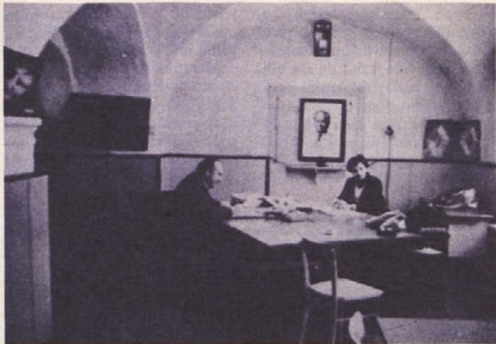
V grmskem gradu imamo za prodajo na razpolago dva prostora. Tega na sliki bi morali že zdavnaj vrniti grmski šoli.