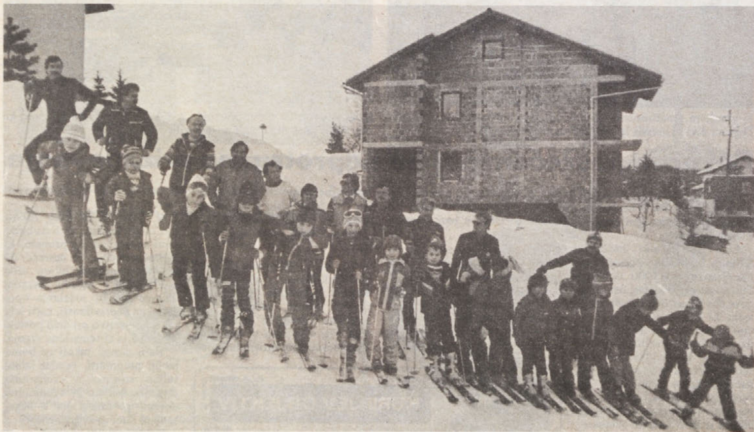
To sta vrsti, ki sta spoznavali prve smučarske veščine kar na Žibertovem hribu.

Menimo, da moramo strokovno službo družbenega standarda pohvaliti za uspešno idejo in organizacijo, zahvala gre tudi voditeljema. Tečaj je bil po mnenju udeležencev dobrodošel in uspešen.