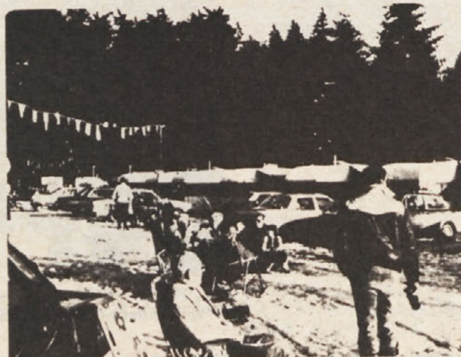
Adria Caravanclub winterkamp in Kitzbühel. Bijzondere belevenis in de bergen...