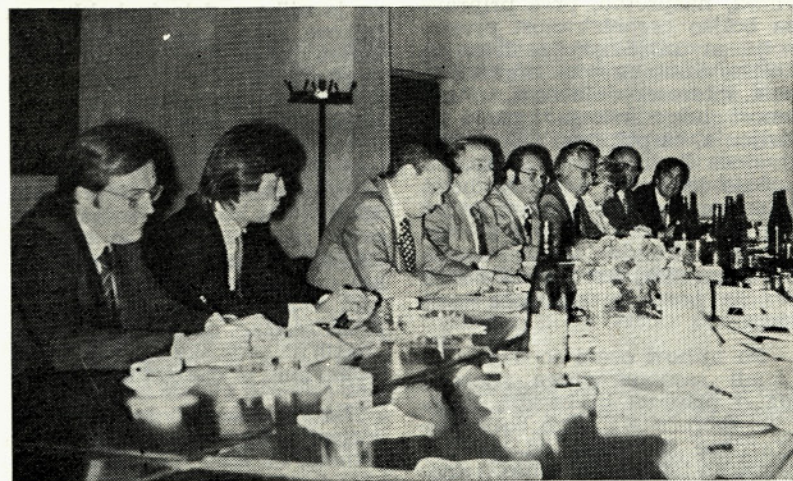
Udeleženci konference proizvajalcev verig