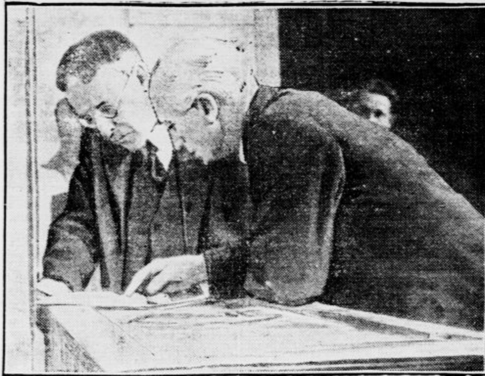
Angleški delegat sir John Simon (desno) v pogovoru z ameriškim državnim tajnikom Stimsonom.