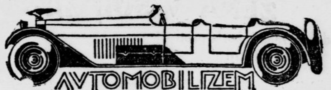
Tehnični del rubrike ureja avtomobilni oddelček Vacuum Oil Company. d. d.