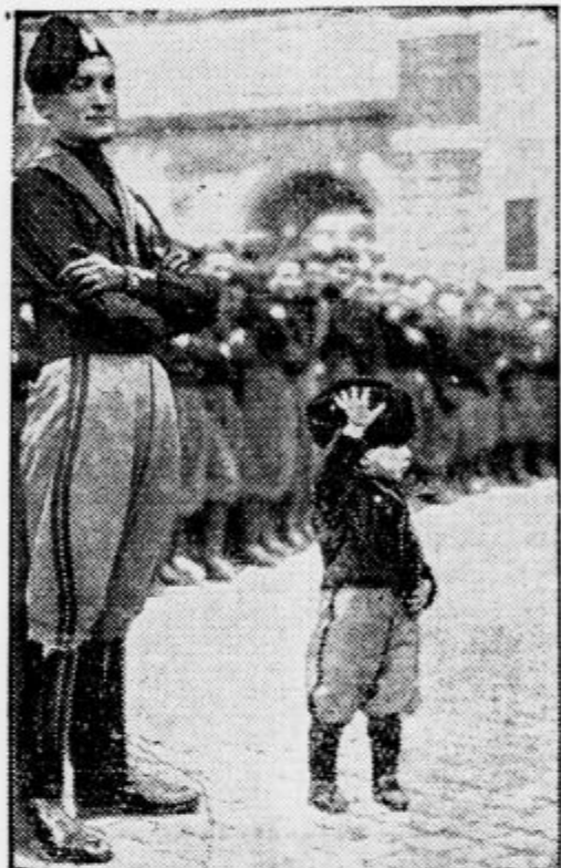
Prizor z vsake fašistovske parade