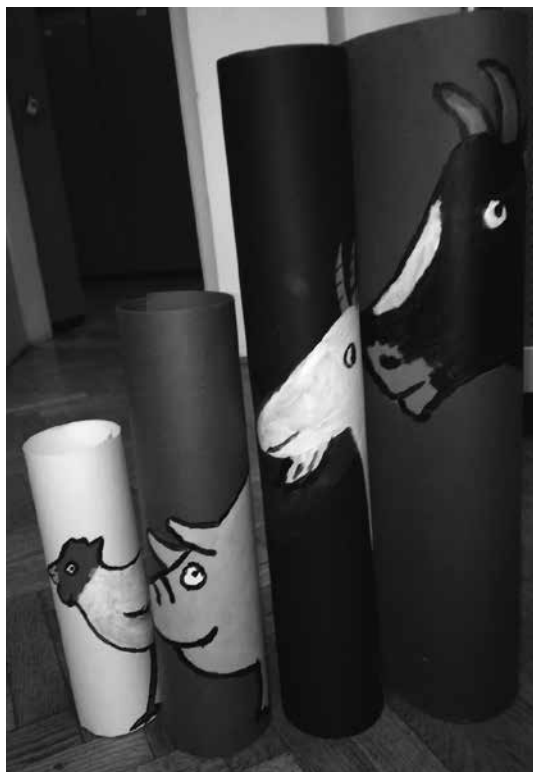
Slika 2: Narisane živali za pravljico Hiška, majhna kot miška

Pri Hiški, majhni kot miški Julie Donaldson je knjižničarka naslikala živali na večje liste papirja, da so otroci dobili možnost spoznavati, kaj pomeni pretesen prostor. Prek spleta so poslušali in oponašali zvoke živali. Zverjasca iste avtorice so gledali na DVD-ju ter preigrali z lutkami, ki jih je izdelala študentka.