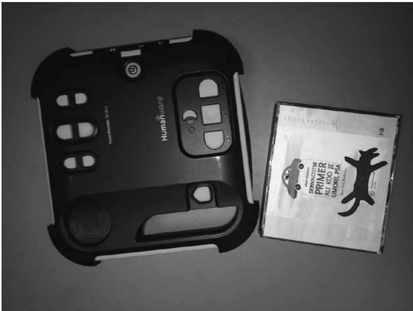
Slika 4: Zvočna knjiga in predvajalnik zvočnih knjig Victor Stratus

starejši od 22 let. Večina jih zna brati, eden se brani uči, ena je gluho-slepa. Ker jih poučujem tudi likovno vzgojo in kreativna znanja, velikokrat vključim knjige že v samo uro. V sklopu notranjega oblikovanja smo se za pusta pogovorili o tem, kaj naredijo preiskovalci, če se zgodi zločin. Predstavila sem jim knjigo Marka Haddona Skrivnostni primer ali kdo je umoril psa , ki smo jo kot zvočno knjigo poslušali na predvajalniku zvočnih knjig Victor Stratus (sicer namenjen knjigam Daisy). V knjižnici smo prekrili police s paus papirjem, rjuhami ter na tla narisali obris psa s krep lepilnim trakom. Jaz sem se preoblekla v belo obleko in si nataknila zaščitna očala ter postala preiskovalka zločina.