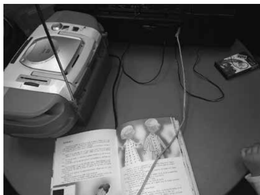
Slika 3: Branje zgodbe Mojster pri hiši ter preverjanje vtikačev

Ko je v nekaterih delih stavbe zmanjkalo elektrike, se je našla starejša knjiga Mojster pri hiši Silvia in Emilije Ružič, ki v eni od zgodbic omenja elektriko. Pri različnih predvajalnikih smo preverjali, kje je vtikač, kabel, katere funkcije imajo gumbi.