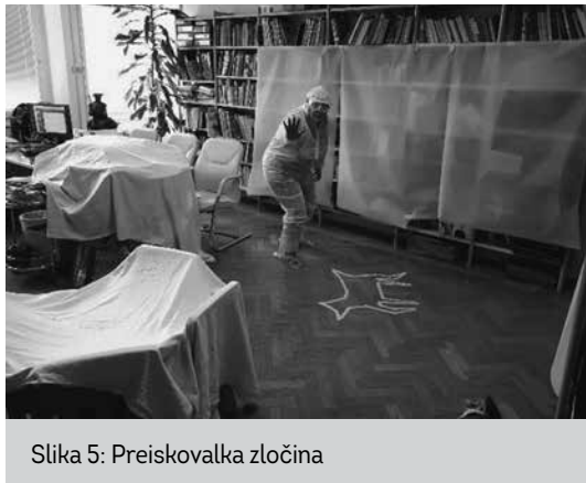
Slika 5: Preiskovalka zločina