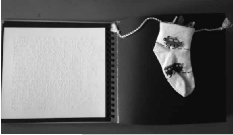
Slika 1: Notranjost knjige Žametni zajček

Predvsem pri slepih se lahko pokaže razlika v razumevanju koncepta besede na dveh nivojih.