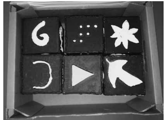
Slika 6: Kocke, s katerimi smo si izmišljevali zgodbe.

Skupina šestih zelo različnih učencev iz drugega in tretjega VIO je najbolj uživala, ko smo si izmišljevali zgodbe ob prilagojenih kockah Rorycubes, ki so jih leta 2017 naredili na OŠ