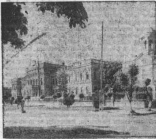
Vojna akademija v Kişinevu

Med deželami, ki jih je morala junija 1. 1940 odstopiti Rumunija drugim državam, sta bili Besarabija in severna Bukovina. To je bila najtežja izguba, ki jo je utrpela Rumunija pri odstopu ozemlja o priliki mejne revizije. Kajti Besarabija je zavzemala tako po obsegu, po številu prebivalstva in po gospodarski pomembnosti prvo mesto. Enajst okrajev je morala Rumunija odstopiti Sovjetski Rusiji, katerih devet so bili sestavni deli Besarabije, dva pa sta pripadala Bukovini. Razen tega je morala Rumunija odstopiti petino k Bukovini spadajočega okraja Radauti in polovico moldavskega komitata Rorohol. Velikost odstopljenega ozemlja je obsegala 49.674 kv. metrov s 3.75 milijona prebivalcev, torej 16 odstotkov skupne površine Rumunije, in 18 odstotkov celotnega prebivalstva.