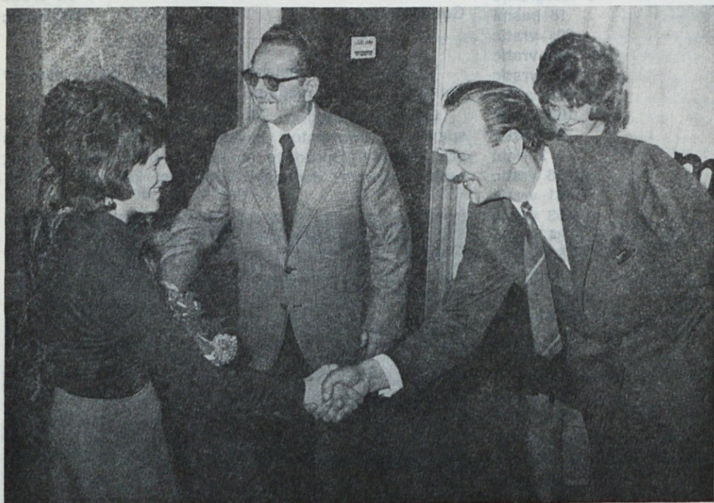
Čestitke in darilo za odličen uspeh v šoli