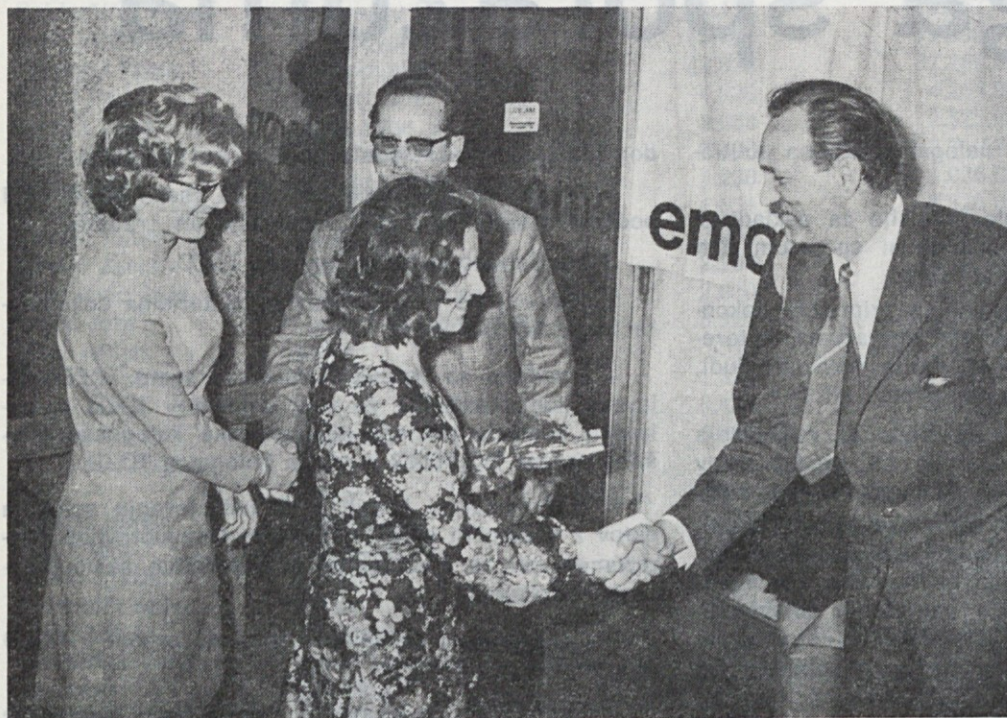
Uspehov učencev so bili veseli tudi njihovi poslodavci