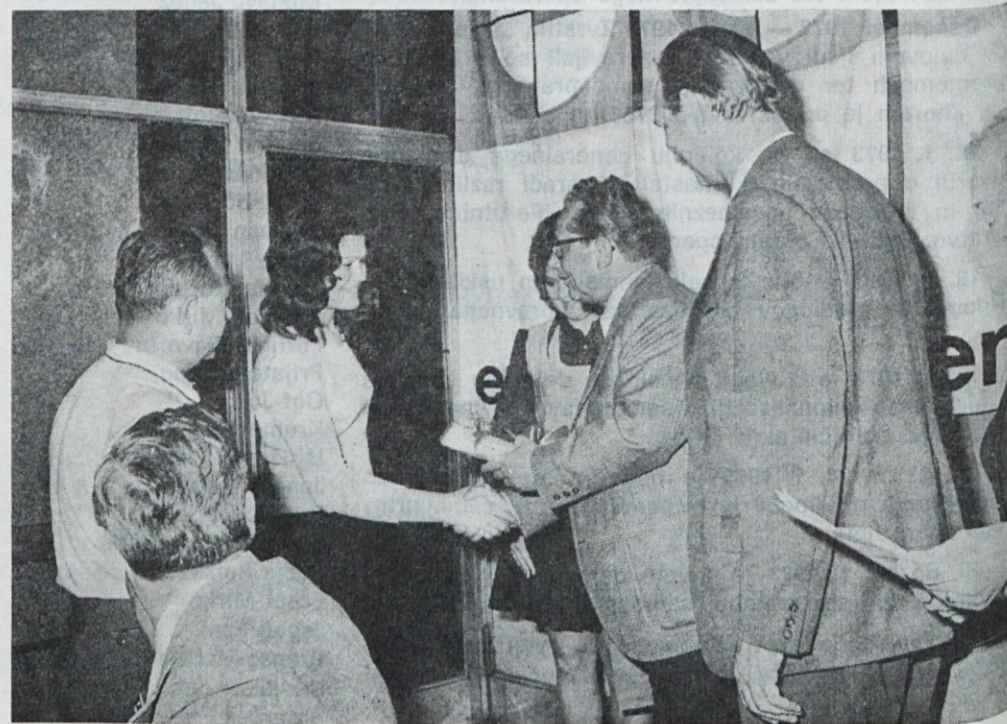
Da bi bila še naprej vestna