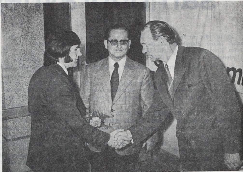
Zastopnikov moškega spola je bilo le malo

V TOZD Maloprodaja Emone Ljubljana se je v lanskem šolskem letu izučilo 62 mladih trgovcev. Po koncu šolanja jih je 17 odšlo iz podjetja, 2 sta na odsluženju vojaškega roka, 45 pa jih je torej razporejenih v trgovinah TOZD Maloprodaja EMONE Ljubljana.