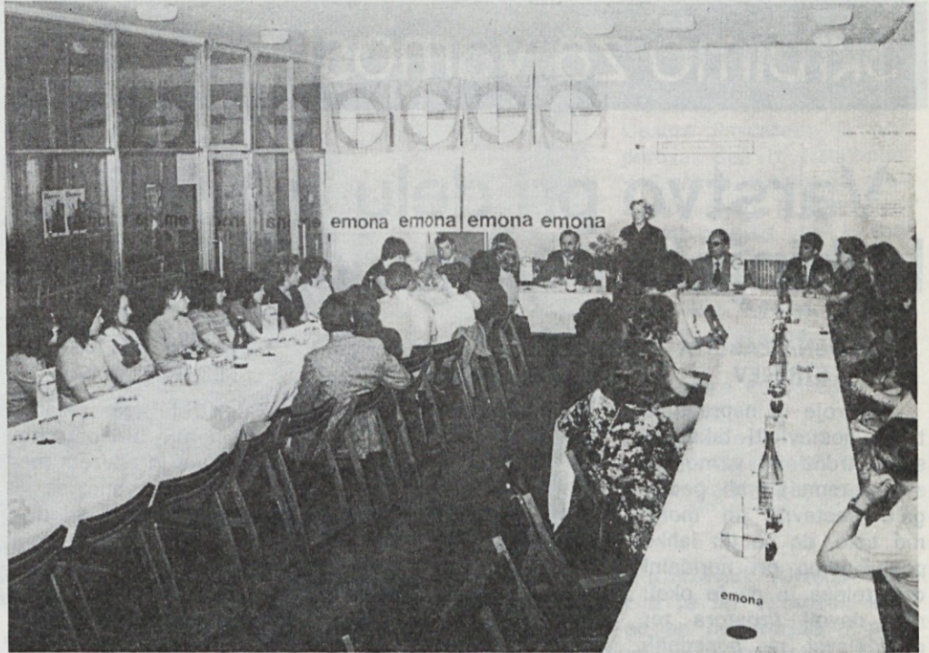
62 mladih trgovcev na TOZD Maloprodaja Emone Ljubljana