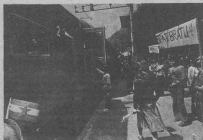
Sprejem vlaka bratstva in enotnosti 1978 v Topčideru

Slovenski izgnanci so v Srbiji opravljali različna dela, da so lahko prehranili svoje družine, politično so se vključevali v narodnoosvobodilne odbore, veliko pa jih je odšlo v partizane, kjer so organizirali četo Ivana Cankarja.