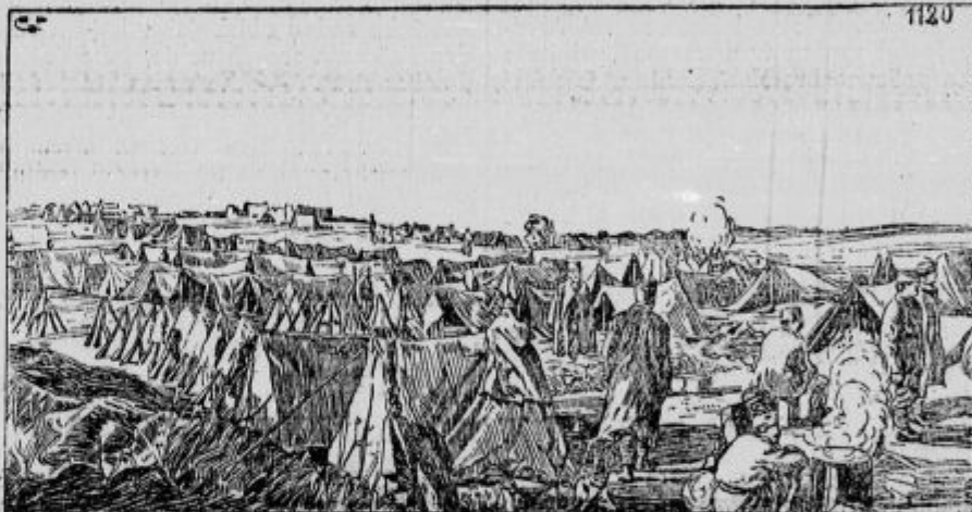
Tabor ubeglih srbskih vojakov na otoku Krfu.