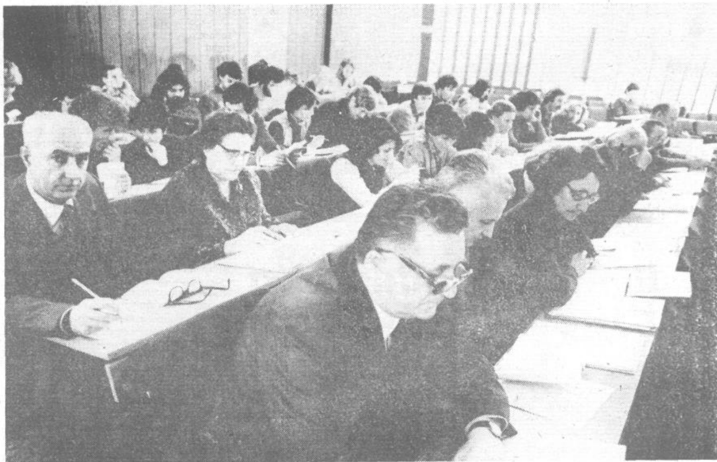
Naš fotoreporter Lado Čuk je ujel v objektiv tale fotografije iz inštruktaže občinskih popisnih inštruktorjev.

Popisovalcu bo v veliko pomoč, če boste razpolagali s potrebnimi podatki o osebah, gospodinjstvu in stanovanju. Še posebej pa opozarjamo na pomožne obrazce , ki so jih nekateri občani prejeli v delovnih organizacijah, kjer so zaposleni in na matične številke , katere so vsi občani prejeli v zadnjih mesecih. Prav tako bodo v veliko pomoč posestni listi , saj se bodo popisovala tudi celotna kmetijska gospodarstva.