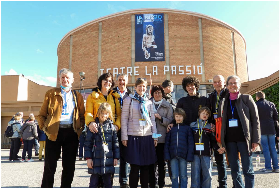
Škofjeloški pasijonci pred pasijonskim gledališčem v Esparregueri.