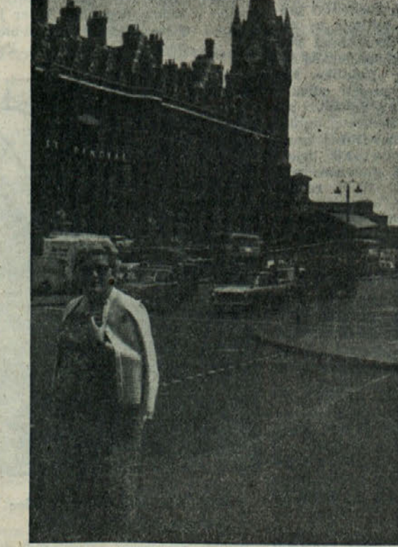
Na obisku v Londonu

Človek je dokaj utrujen in nasičen od vsega in šele kasneje dojema vso veličino te lepote in moči človeške ustvarjalnosti, ki jo je videl. In zopet priprave za nadaljevanje potovanja. Ob 8. uri zjutraj smo odpotovali iz kolodvora »Paris Nord« proti lukci Calais, kjer smo se ukrcali na ladjo za prevoz v Anglijo. Zanimivo je, da vozijo v to smer velike kompozicije vlakov še vedno običajni stroji na paro, vendar take moči, da imajo tudi ti velike brzine. Vozili smo se preko mesta Amiens proti obali La Manchesha po tistem delu Francije, ki je bil med drugo svetovno vojno najbolj prizadet. Od pristanišča St. Valery ob obali, preko mosta Baulogne pa vse do Calaisa je pokrajina razrita od vojnih grozot. Izgleda, da so nekatere tovarne sploh opustili. Polja so lepo obdelana, a nadvse so urejeni vinogradi in sadovnjaki, ki so v tem predelu glavna gospodarska veja. V pristanišču Calais, ki se mu še tudi pozna vojna, smo se vkrcali na brod, ki nas je v dobrih dveh urah prepeljal po zelo slabem morju preko morske ožine Pas de Calais do angleškega vhodnega pristanišča Folkestone. Na sami ladji si lahko opazoval marsikaj, če si imel dober želodec in nisi