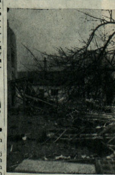
Fotografija prikazuje posledice hudega vetra na Rudniku

Preteklo soboto je neurje z moč- ním vetrom zajelo tudi naše kra- je. Ze v noči od petka na soboto je veter odkril več streh. Najhuje je bilo v soboto dopoldne. Veter je pihal z vliko močjo, kar je bilo tudi za naše kraje redkost. Pri