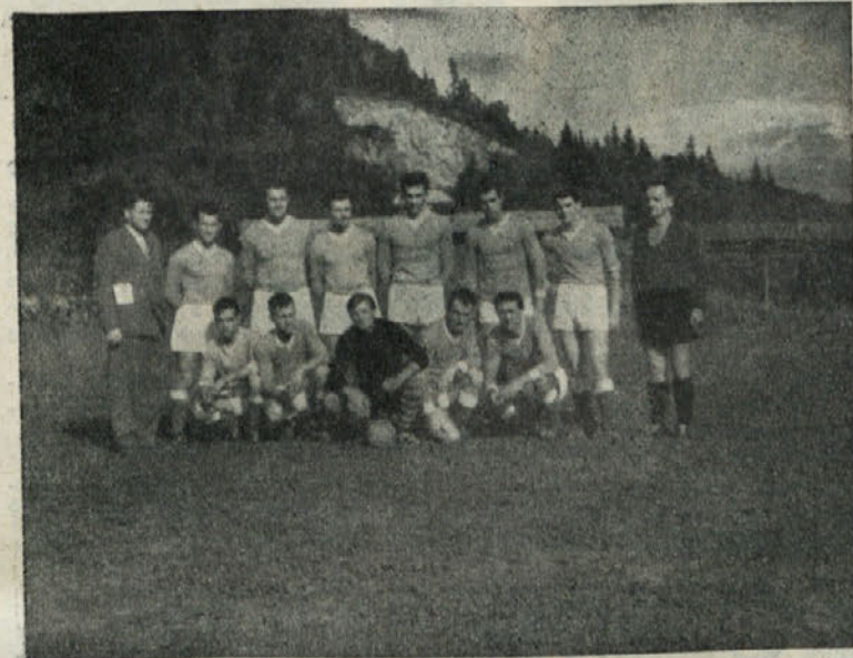
Ribniški nogometaši so dosegli lep uspeh