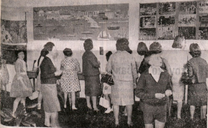
Razstava risb in ročnih del na nižji srednji šoli v Trstu

Uprava Slovenskega dijaškega doma v Gorici