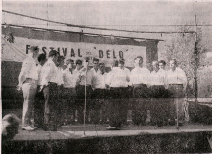
FESTIVAL «DELA» 1962: Obsežen in pester spored prireditev je privabil v Dolino tisoče obiskovavcev. Za letos je predviden še lepši program. Na gornji sliki: pevski zbor iz Križa, ki bo tudi letos nastopil