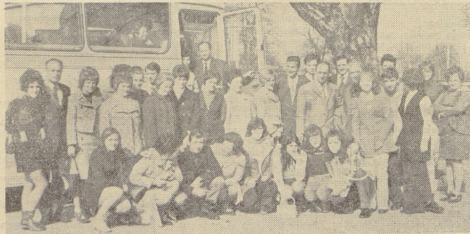
Udeleženci kolektiva odd. ATN Blejska Dobrava so bili z ekskurzijo v obrat uporov v Šentjerneju zelo zadovoljni

Sindikalnemu odboru gre vsa zahvala za zelo dobro organizacijo ekskurzije. Želimo, da bi lahko obiskali še druge tovarne in obrate, saj bi le na tak način lahko v celoti spoznali proizvodnjo našega podjetja in si s tem izmenjavali mišljenja in izkušnje, kar bi nam kot najmlajšemu kolektivu Iskre mnogo pomenilo in tudi koristilo.