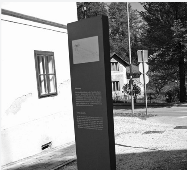
Informativna tabla pri gradu. (Foto: N. Šekoranja, april 2015.)

Pri gradu poišči informativno tablo, ki označuje južna mestna vrata. Tudi ta vrata označi na zemljevidu na str. 62 z X. (Ne pozabi na legendo.)