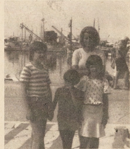
Najljubši kraj za dopust: Piran. Tukaj je slikal ženo in otroka ter bratovega sina.