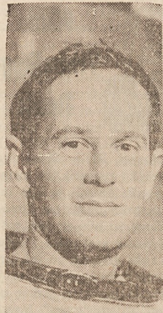
Charles M. Duke Jr.