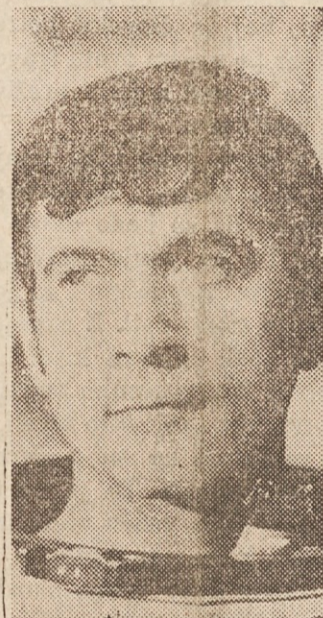
John W. Young