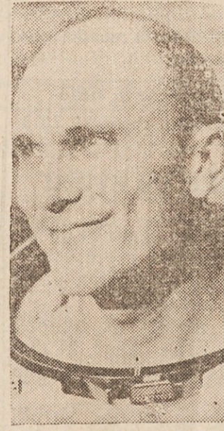
Thomas K. Mattingly II

Do 70 urah na površini Lune in po troji vožnjah po njej, na katerih sta nabrala 245 funtov lunskega kamnca, sta se astronauta John W. Young in Charles M. Duke sinoči ob 8.26 dvignila z Lune površine in se po zakrožitvi okoli Lune dve uri kasneje povezala z matično ladjo Casper. Nocoj ob 9.16 bodo astronauti pognali glavni motor matične ladje in krenili nazaj proti Zemlji, katero bodo dosegli na Pacifiku v četrtek ob 2.44 popoldne.