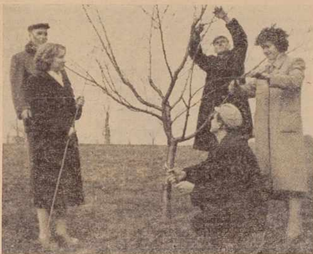
Kmetijsko-gospodarsko šolo v Moščancih obiskuje 23 mladincev in mladink. Na sliki: pri obrezovanju sadnih dreves

O vseh teh in še mnogih zadevah so mnogo razpravljali na včerajšnjem občnem zboru in sprejeli več sklepov. Po razpravi sodeč, bo turistično društvo v Radencih spet zaživelo. Prenovljeni odbor nam jamči, da bo šel z novim poletom na delo. Uspelemu občnemu zboru sta prisostvovala predsednik občinskega ljudskega odbora ter predsednik občinske turistične zveze iz Gornje Radgone. Ika