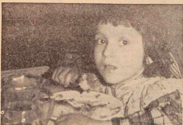
Dober tek! Mala Inka, ki jo je ujel naš fotoreporter pri obilnem zalogaju, je brzkone najmlajši abonent lendavskega »Triglava«. Medtem, ko sta očka in mamica v službi, se vrne iz vrta in gre na kosilo. Samostojnost, kajne?