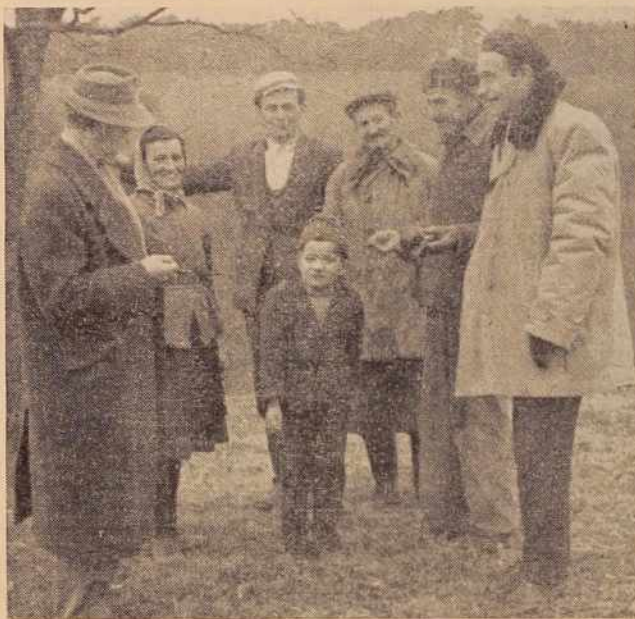
Naš sodelavec v pomenku s Krnčani