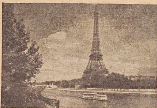
Eiffelov stolp v Parizu

— da bi doprinesel popuščanju mednarodne napetosti (29 odst.); da bi se okreplili odnosi s SZ (25 odst.); zaradi ugleda (4 odst.); zaradi diplomatske vljudnosti (6 odst.); zaradi razprave o Alžiru in Sahari (5 odst.); ker general de Gaulle igra na rusko karto proti ZDA (5 odst.) itd. Sveveda so te dni zabeležili tudi določene izgrede in celo sabotaže. Tako so skrajneži metali celo bombe na določena mesta. Sveveda tako ravnanje samo opozarja vlado, da naj bo pripravljena na vse. Resnico, da so oblasti poslale na »prislilni odhiti« številne tuje emigrante na Korziko, je vsem znana, ker bi utegnili pripraviti kakršno koli dejanje, ki bi utegnulo vplivati na razgovore in na — razpoloženje Hruščeva. Omenimo naj tudi še organizacijo skrajnega desničarja Georgesa Saugeja, ki je pred dnevi poslal sovjetskemu veleposlaniku v Parizu Vinogradovu pismo, v katerem zahteva, naj Hruščev javno odgovori na »nekatera vprašanja«.