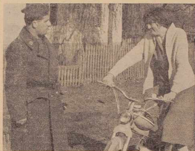
Voznja z mopedom brez ipita ni dovoljena

Letos bodo dogradili stanovanjski blok z dvanajstimi družinskimi stanovanji, za tem nameravajo pričeti graditi še stanovanjske bloke VG Ljutomer, »Agrotehnikaservis« Ljutomer in manjši stanovanjski blok za učitelje v Stročji vasi.