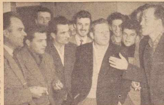
Slušatelji kmetijske šole v Rakičanu med odmorom

In težkoče? V vseh štirih oddelkih isto: anatomija pri predmetu živinoreja, biologija in kemija. Vendar tudi tukaj gre, saj blada pri učenju pravo tovarništvo. Tisti, ki snov hitreje dojemajo, pomagajo drugim. Učni program je zelo