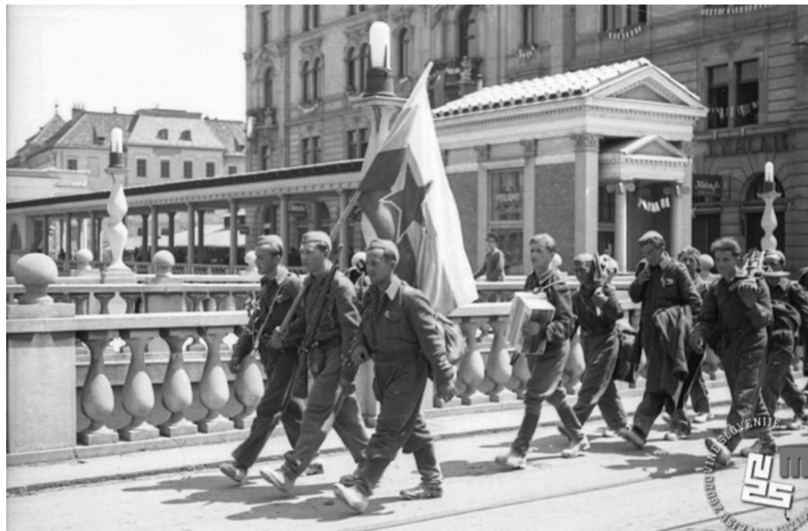
Prihod partizanov v Ljubljano 9. maja 1945.

Brez dvoma je prihodnost narodov in držav v Evropi odvisna tudi od tega, na kakšen zgodovinski spomin se opira. Tega se očitno zaveda Evropski parlament (EP), ki je 19. septembra letos (2019) sprejel resolucijo Pomen evropskega zgodovinskega spomina za prihodnost Evrope (R 2019). S to resolucijo, ki so jo podprli tudi slovenski poslanci razen ene same izjeme (dr. Milan Brglez), EP po eni strani nadaljuje, hkrati pa dopolnjuje usmeritev, ki jo je pred desetimi leti začrtala Resolucija o evropski zavesti in totalitarizmu (2. april 2009). Letošnja resolucija naj bi prispevala h krepitvi enotnosti »evropske družine«, ki se je precej povečala 2004, ko so se vanjo »vrnile« države, ki so trpele »pod sovjetsko okupacijo in komunistično diktaturo«; ker je od tega leta (pohlevna) članica te družine tudi Slovenija, je prav, da vsaj v grobem