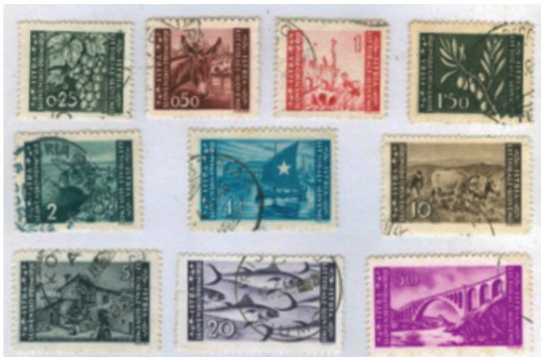
Končna realizacija serije znamk za slovensko Primorje in Istro

sta, zato ni bilo znamke za 1 liro Sv. Just (Trst). Danes jo poznamo le kot »neizdano« v rjavi in rdeči barvi, rezano in/ali zobčano. Pismo Poštne direkcije je bilo namreč