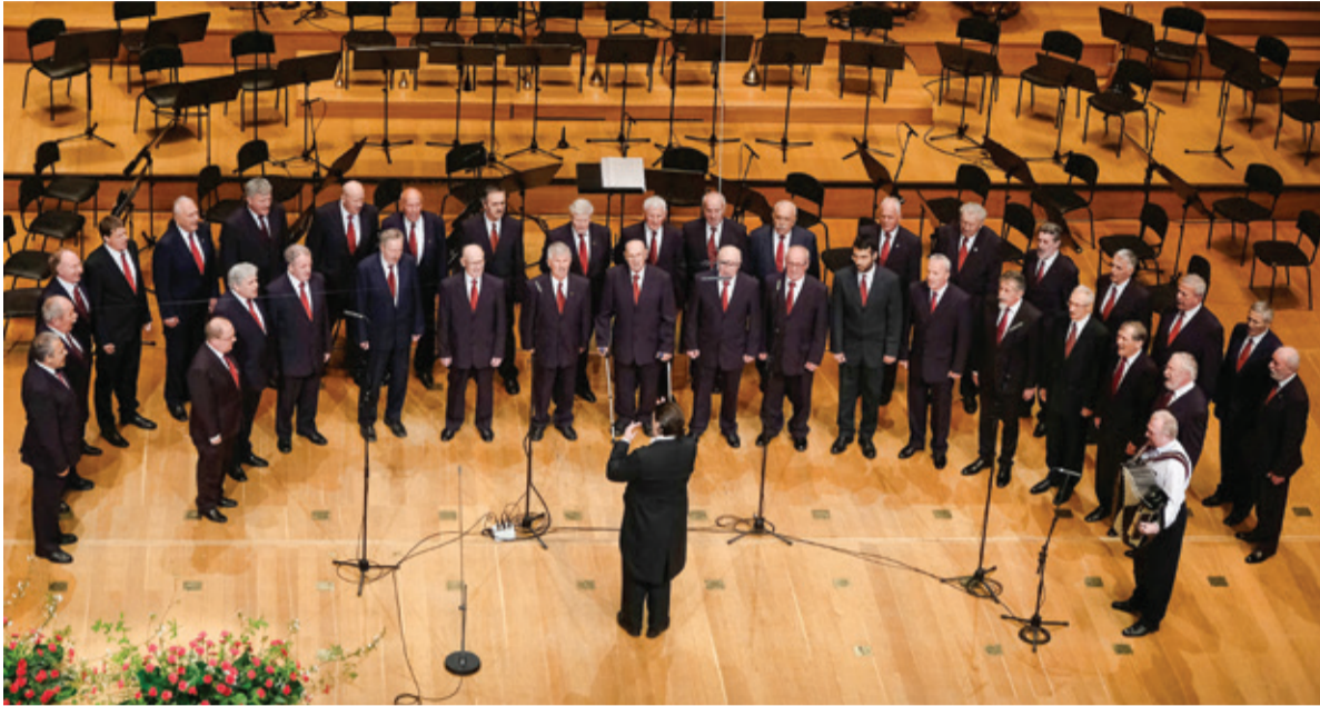
Partizanski pevski zbor