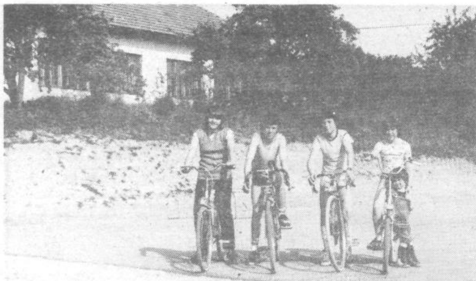
Večnamenska športna ploščad pod podružnično šolo bo omogočila razvoj športne dejavnosti v krajevni skupnosti Rudnik