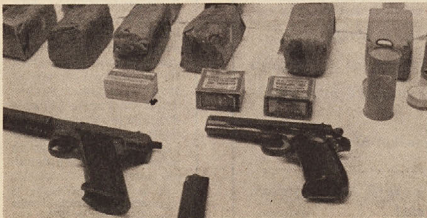
Dokazi fašističnega «reda»