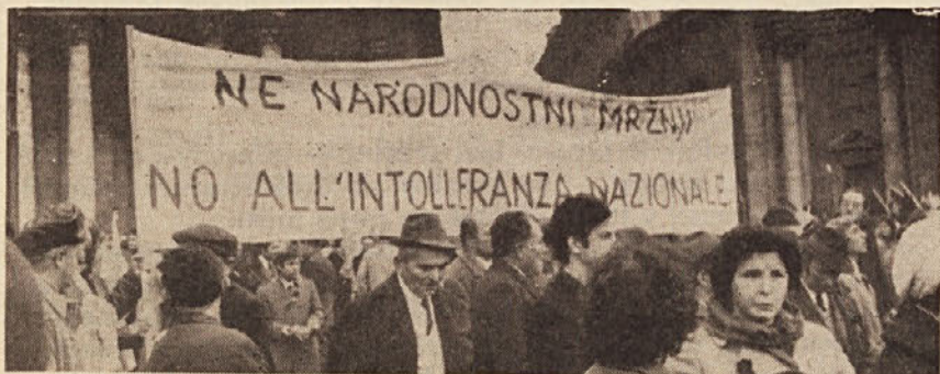
Velike protifasistične manifestacije, ki je bila pred meseci v Rimu, so se udeležili tudi Slovenci iz naše dežele.

«...Zakonski predlog, ki smo ga predložili 11. avgusta letošnjega leta, smo izdelali na številnih sestankih ter razpravah ob prisotnosti mnogih tovarišev in