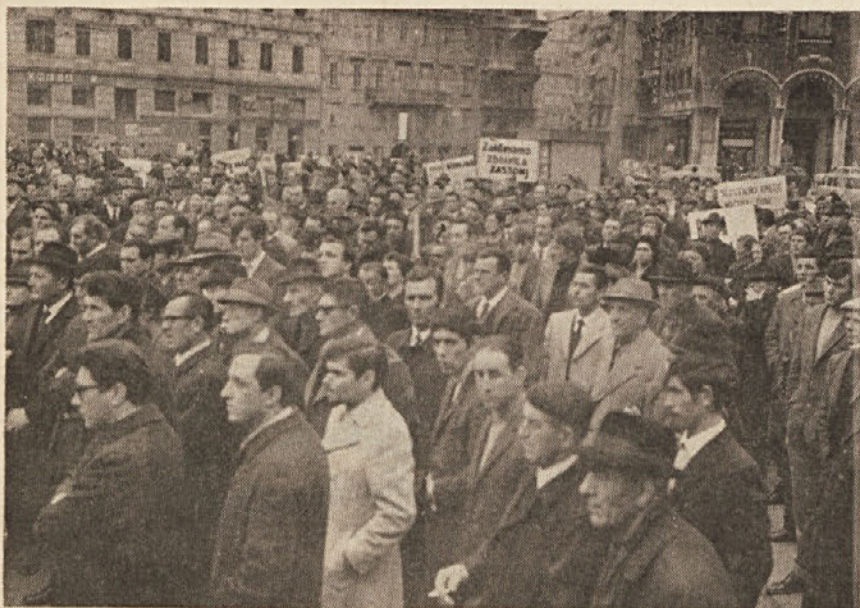
Kmetje iz vse dežela zbrani v Trstu terjajo pravico; dežela jih mora poslušati in sprejeti ustrezne ukrepe za razvoj in zaščito male in srednje posesti «Coldiretti» je v službi monopolov.

glasilo KPI za slovensko narodno manjšino Direktor Marija Bernetič Ureja uredniški odbor Odgovorni urednik Anton Mirko Kapelj Uredništvo in uprava: Trst — Ul. Capitolina 3 Dopisništvo v Gorici: Ul. Locchi 2 Letna naročnina 1.000 lir Poštni tekoči račun: Trst 11/7000 Tisk: Tip. Riva - Trst Ulica Torrebiana, 12