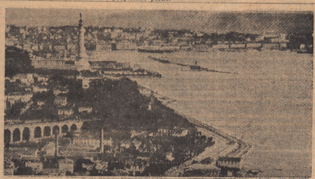
SLOVENSKO PRISTANIŠČE TRST

Kardelja in Rankovića je sprejel trenutni zmagovalec v zadnji borbi za absolutno oblast, tajnik komunistične stranke Hruščev.