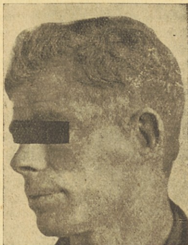
Solnčni rak na lieu. Levo: začetek, desno: isti ozdravljen.

rak ter se prepričati kako uspešno je zdravljenje če se začne z njim o pravem času . Poznal sem mnogo žensk, ki so se prišle zdraviti z ogromnim turom na prsih, ki se je razlezel že v žleze, tako da niso zaupale niti najmanjše podrobnosti niti svojemu soprogu, niti nčerkam. Ko smo vprašali tako bolnico zakaj da je bolezen toliko časa zatajevala, smo dobili vedno isti odgovor: iz bojazni, da bi ne šlo za raka, je raje živela cele mesece v smrtnem strahu. Pomisliti je treba, kako lahko bi bilo rešiti vsako bolnico z rakom na tako lahko dostopnem mestu!