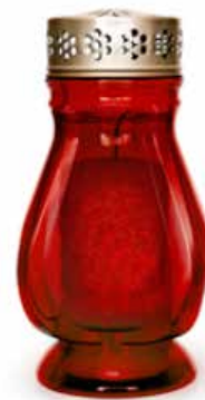
Prižgite elektronsko svečo

Če se vseeno odločite za nakup sveče, izberite elektronsko ali solarno svečo, ki gorita zelo dolgo, materiale pa se lahko reciklira.