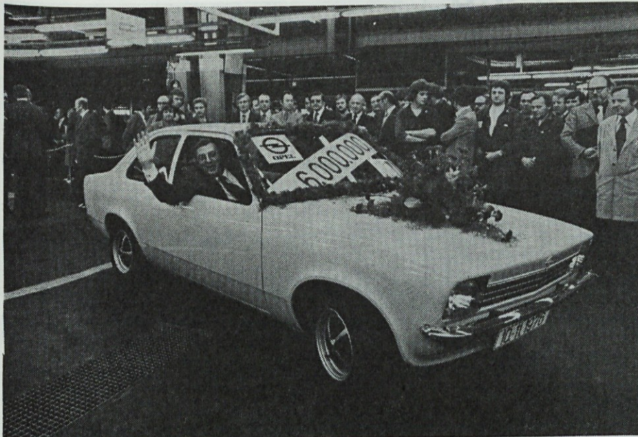
Šestmilijonti Opel je 10. XI. 1976 prišel s tekočega traku tovarne Opel v Bochumu. To je bil Opel Kadett, vozilo, ki se izdeluje v največ varientah. Na sliki: šestmilijontno vozilo Opel zapušča tovarniške prostore v Bochumu.