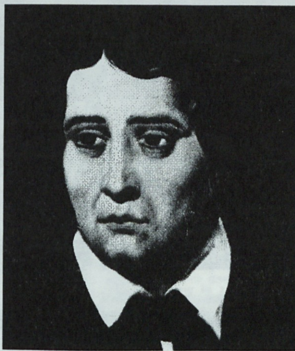
Največji slovenski pesnik FRANCE PREŠEREN