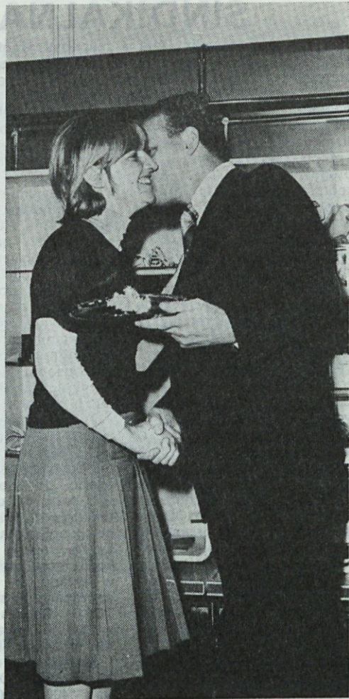
Krepak stisk roke in iskrene čestitke