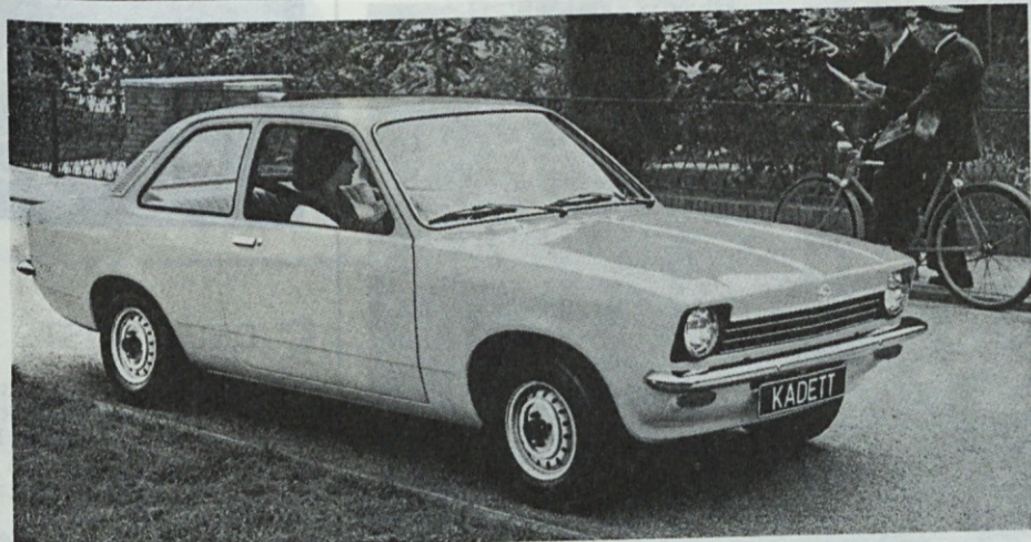
OPEL KADET — ECONOMY 1196 cm 3 , 50 KS Do sedaj prodanin 1263 komadov