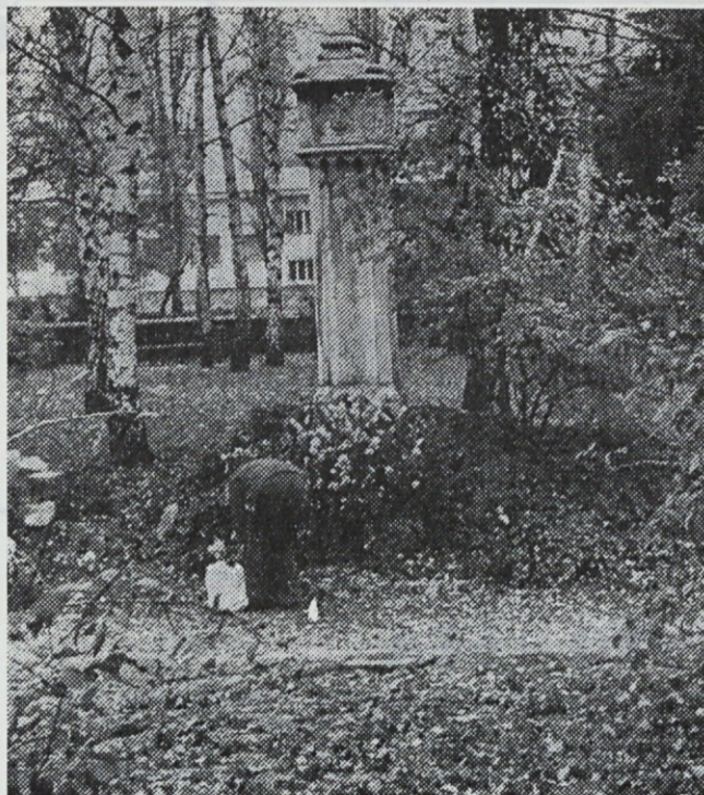
Prešernov grob v Kranju

Ce pa se sneg sesede, gre iz njega večina zraka, ne greje več tako dobro. Tudi stara obleka, katere pore so zamašene z umazanijo, ni več tako topla. Zato jo kličemo, da odstranimo prah in pustimo vstop zraku. Če pa se tkanina splošči, ne zadržuje toplote, tako kot zmrznjen sneg.