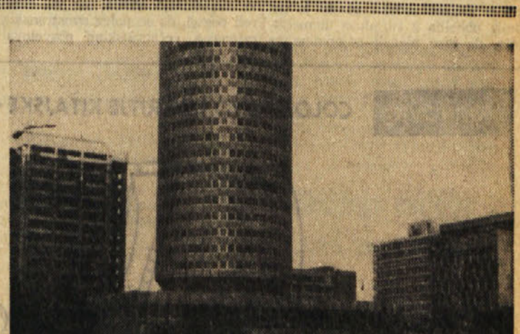
Središče Nairobi

Možbi bi se, če bi pričakovali v Keniji gledališko življenje