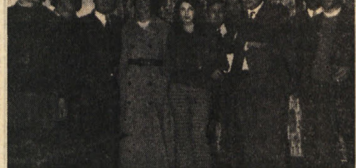
Izvoljeni odborniki Doma

lu pa so naši tekmovalci pričeli prinašati domov tudi uspehe. Zakaj smo obnovili športno združenje Dom? Videli smo, da se slovenska mladina v mestu rada udeležuje na športnem področju, v mestu samem obstaja še drugo slovensko športno društvo, vendarle vsi naši mladinci niso hoteli v to društvo. Poleg tega smo sodili in danes bolj kot kdajkoli merimo, da se morajo naše ekipe udeleževati raznih prvenstev, da je naša naloga tekmovalci v prijateljskih tekmah z vsemi tujakšnimi ekipami, naša naloga pa je tudi go-