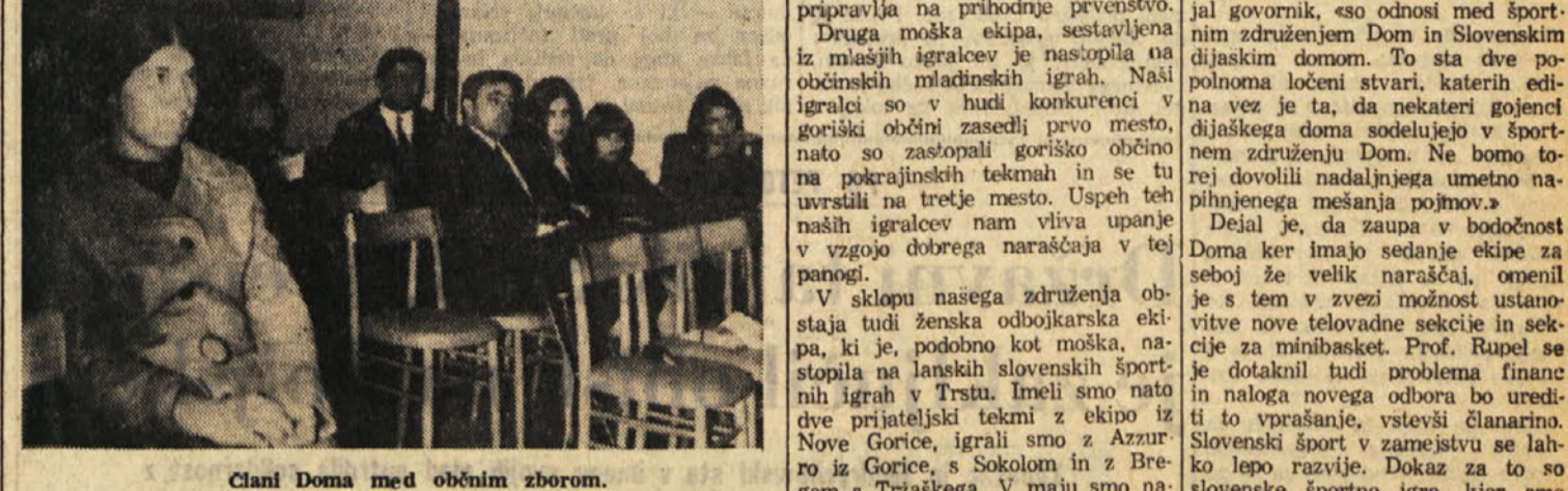
Člani Doma med občnim zborom.

lu pa so naši tekmovalci pričeli prinašati domov tudi uspehe. Zakaj smo obnovili športno združenje Dom? Videli smo, da se slovenska mladina v mestu rada udeležuje na športnem področju, v mestu samem obstaja še drugo slovensko športno društvo, vendarle vsi naši mladinci niso hoteli v to društvo. Poleg tega smo sodili in danes bolj kot kdajkoli merimo, da se morajo naše ekipe udeleževati raznih prvenstev, da je naša naloga tekmovalci v prijateljskih tekmah z vsemi tujakšnimi ekipami, naša naloga pa je tudi go-