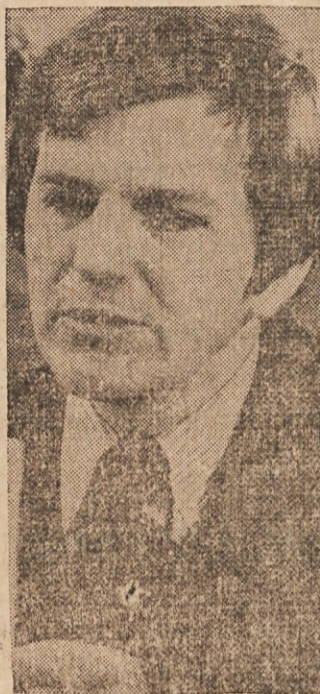
ODGOVORNOST DRŽAV — Zvezni tajnik za zdravstvo, šolstvo in socialno skrbstvo David Mathevs (na sliki) misli, da bi naj večji del odgovornosti za javno zdravstvo prevzele države namesto zvezne vlade.

Delo na tem področju je bilo doslej omejeno le na posamezna obdobja, nestrnjeno, včasih slučajno, in le redko za daljša sistematično. V teh prostorih bo mestni muzej lahko nadaljeval s pripravo dokončnega sce-