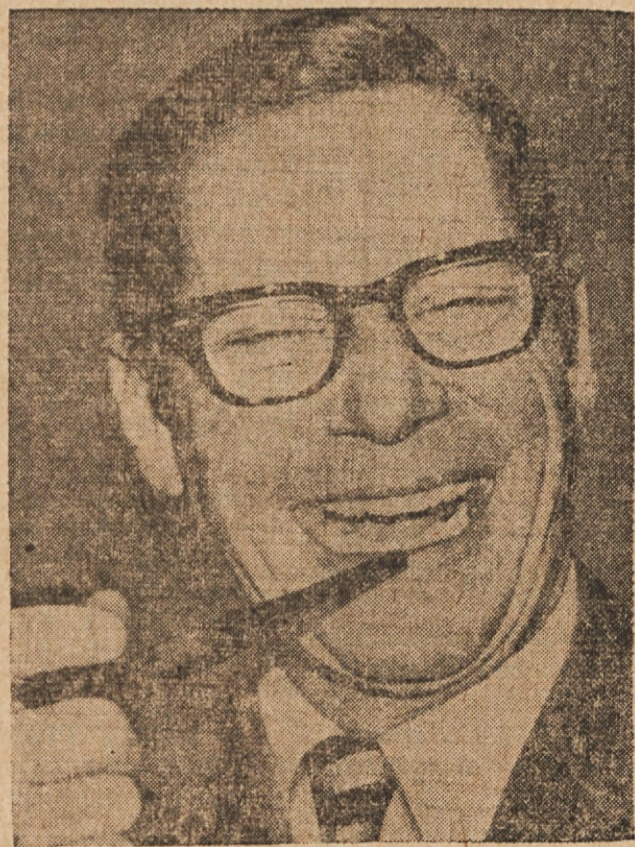
DOBRO VOLJE — Zakladni tajnik William Simon se zadovoljno smeji, ko je bil novi zvezni proračun v Kongresu sorazmerno ugodno sprejet.