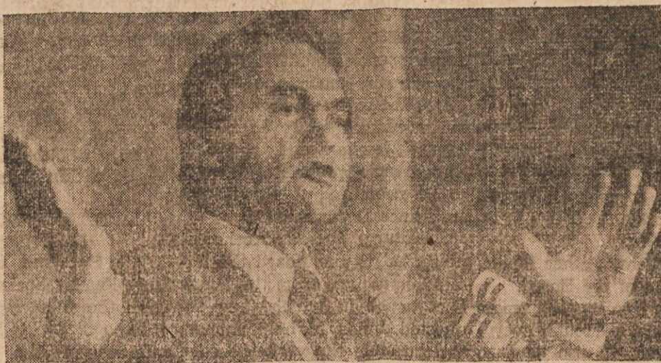
V OSPREDJU, PA BREZ UPA ZMAGE — G. C. Wallace iz Alabame (na sliki) se je pri primarnih volitvah kar dobro izkazal, pa vendar nihče ne računa z možnostjo, da bi bil izbran za demokratskega predsednika kandidata.

Povejte to sosedu, ki še ni naročen nanjo