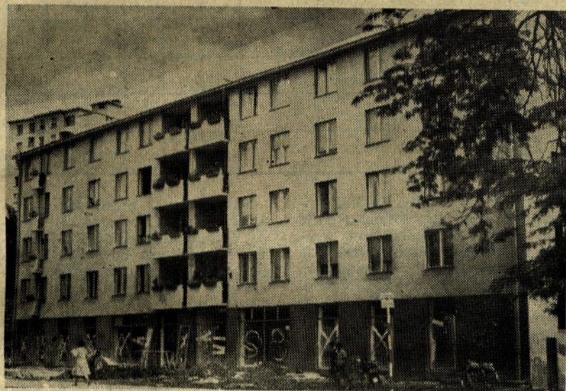
Stanovavci našega bloka ob Mariborski cesti so lahko hvaležni podjetju »Merx«, da je uredilo prostor pred blokom, ki je bil tega že močno potreben.

Prepričani smo pa, da bo trgovina zamašila precejšnjo vrzel, ki so jo že leta čutili potrošniki v tem delu mesta.