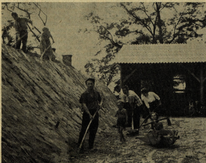
Strelci, člani sindikata in mladinci pri izgradnji strelišča za malokalibrsko puško.