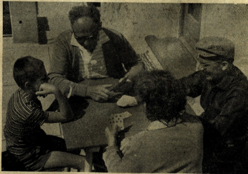
Karte so ob večerih priljubljena zabava. Tako meni tudi glavni direktor, ki smo ga zalotili pri nedolžnem »dureku«.