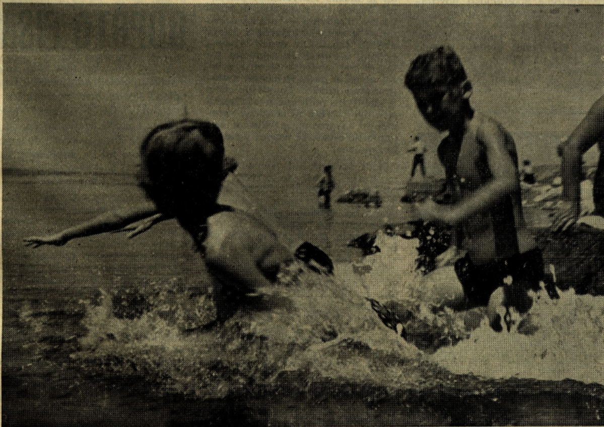
V vodo!... In sinja, kot zrelo mirna morska gladina se je zapenila. Otroci delavcev našega kolektiva so v morju našli nove radosti; doslej neznanu okolje jim nudi nešteto možnosti za njihovo veselje. Reportažo s Crikvenice, kjer letujejo naši ljudje, berite na 6. strani.

Na nedavnem zasedanju skupščine so sklenili, da podjetje najame pri Gospodarski banki LRS premostitveni kredit za kritje razlik pri rekonstrukciji, ki so nastale zaradi podražitve nekaterih storitev. Hkrati so pa še pooblastili vodstvo podjetja, da se prične pogajati z Investicijsko banko za posojilo pod kar se da ugodnimi pogoji. Oba kredita bosta služila za nadaljevanje in pospešitev rekonstrukcijskih del.