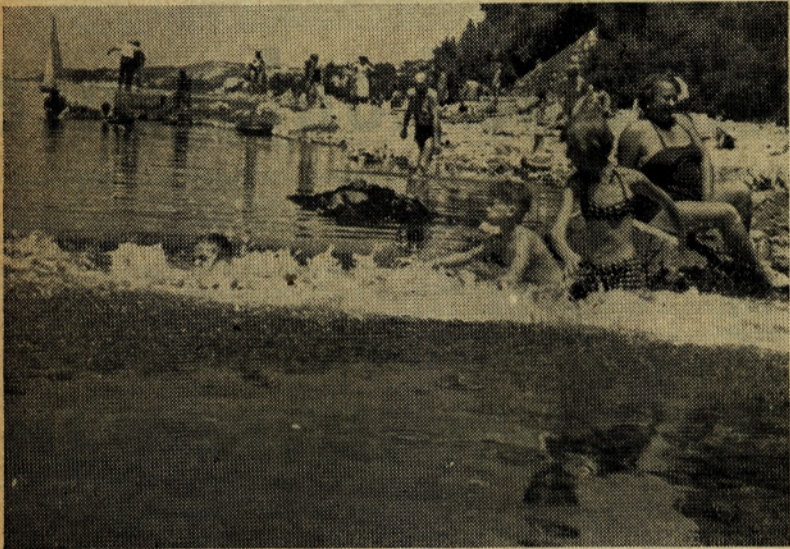
Plaža, ki je bila še pred kratkim osamljena, je zaživela. Vsakdo išče svoj prostorček na soncu. Vendar je treba tudi v vodo, saj le na pripekajočem soncu ni moč vstrajati.