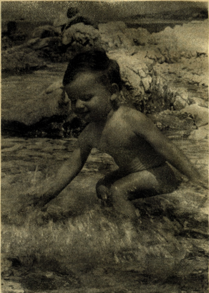
Rok je bil najmlajši član naše počitniške skupnosti, saj je na morju dočakal devetnajst mesecev starosti. Po zadovoljnem izrazu na obrazu sodeč, mu kopel prija...

Tudi zabave je dovolj. V prid temu je v veliki meri tekmovanje za goste med dvema najbolj ekskluzivnima hoteloma: med Therapio in Esplanado. Ne mine dan, ko ne bi opozarjali plakati na kakšno družabno prireditev v tem ali onem hotelu. Če ni nastop folklorne skupine, je večer opernih arij ali kakšna plesna prireditev. Vsak dan so tudi izleti na Rab, da o vožnji na otok Krk ne govorimo, saj je moč tjakaj vsaki dve uri. Veliko je tudi športnih prireditev, ki poleg rednih pred-