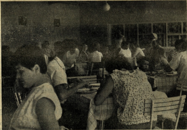
Hrana je ukusna, dobra in obilna. Neprijetno je le v dežju, ker streha jedilnice prepušča. Četudi je jedilnica prijetna, prostorna in zračna, to pomanjkljivost zamerimo graditeljem...

Vendar vas naj ne bo strah — morje se je v nekaj dneh že tako segrelo, da je z njegovo temperaturo zadovoljen celo moj znanec, čolnar. Bil sem pač vaša predhodnica na Jadranu, zato sem se kopal v morju, ki je bilo nekaj