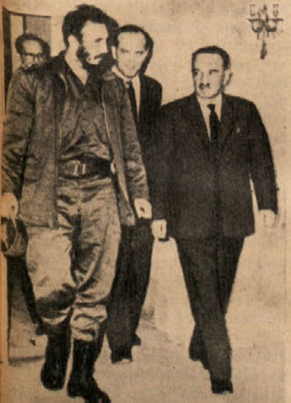
Obisk podpredsednika sovjetske vlade Mikojana na Kubi. Ta obisk je bil velikega pomena za rešitev karibske krize in ohranitev kubanske neodvisnosti

KNJIZNA PROIZVODNJA NA MADZARSKEM je v letu 1961 znašala 3444 del v skupni nakladi nad 40 milijonov izvodov. V primerjavi s 1960 je zabeležen pomemben porast. Tega leta je izšlo namreč le 2972 del v 34,7 milijonov izvodih.