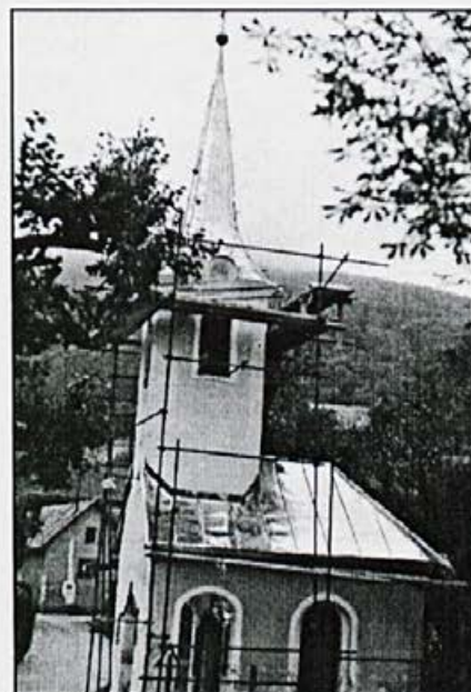
Obnova vaške kapelice, posvečene rožnovenski Mariji.