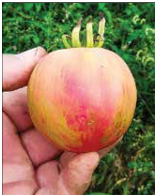
Paradižnik Mazej Pink furry boar

Že prvo leto vzgoje paradižnikov je imel v zbirki 30 različnih vrst. Nato se je množila in lani zrastle do številke 400, letos pa se je skrčila na 340. Pred sedmimi leti so doma postavili rastlinjak. »Ko sem razmi-