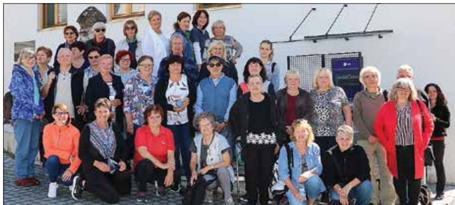
Ex-tempora Rečica 2020 so se udeležili ustvarjalci iz vse Slovenije.