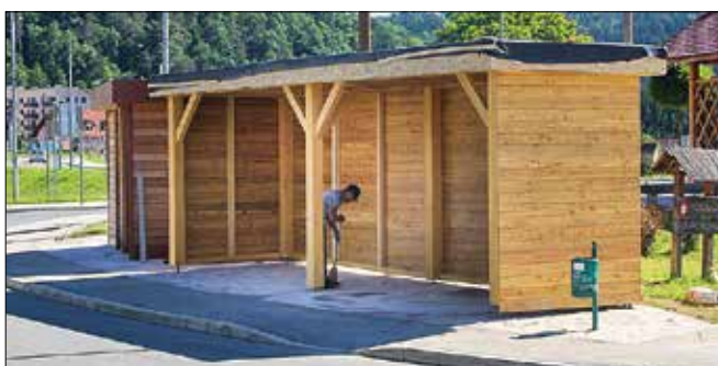
V objektu pri TIC-u v Mozirju bo lahko sedem ali osem avtomatov za prodajo lokalnih proizvodov.

Ker je trško jedro zaščiteno, tovrstna dejavnost vanj ne sodi. Med iskanjem primerne lokacije sta bila bistvena kriterija dostopnost in bližina javnega parkirišča. Določen je