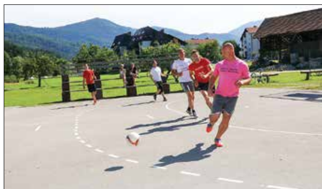
Obiskovalci so lahko uživali v odličnih akcijah in številnih zadetkih.

Do finala sta se prebili Trnina in Prihova, ki sta skozi celoten turnir prikazali všečno, dobro, hitro in atraktivno igro. Tudi v finalni tekmi so tekmovalci obeh moštev doka-