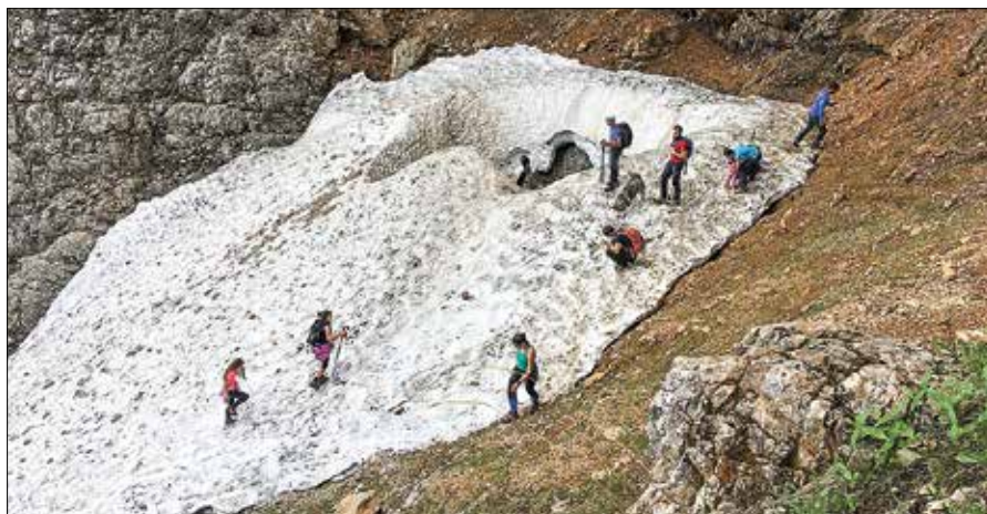
Do Matkovega škafa, ki je letos globok osem metrov in širok dvanajst, se je podalo 35 pohodnikov.