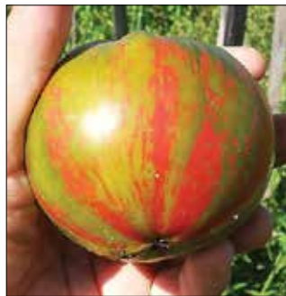
Summer of love