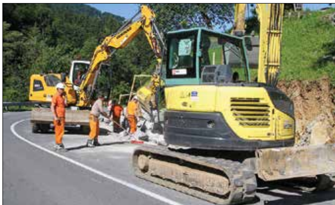
Delavci podjetja VOC Celje bodo povečali pretočnost prometa in varnost na tem delu Soteske.

Do problematičnih situacij pri vožnji skozi ta ovinek prihaja predvsem v primerih, da se ravno tam srečujejo tovorna vozila in avtobusi. Glede na gostoto prometa je širina cestišča na tem mestu preozka. Vozniki, ki ovinek poznajo, ga ubirajo počasi in previdno, da lahko v primeru sreče-