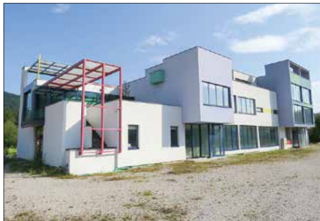
Enota Vrba se bo s Prihove preselila v stavbo na Mozirskih tratih.

»Zaradi selitve ne bomo potrebovali novih zaposlitev, ker smo