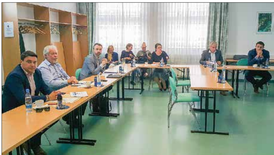
Direktorji in podjetniki si želijo, da bi bili ukrepi, ki jih nudi država, bolj enostavni za koriščenje.