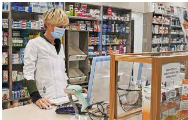
Farmaceutke pri svojem delu dosledno upoštevajo potrebne zaščitne ukrepe.

Zaposlene v Lekarni Mozirje so ves čas trajanja epidemije skrbele za nemoteno izvajanje lekarniške dejavnosti, saj je v izrednih razmerah preskrba z zdravili še toliko bolj pomembna. Kljub številnim spremembam tako v delovnem času kot v obveznem zaščitnem obnašanju pri vstopu v lekarno ter ravnanju farmacevtk v skladu z odredbo o omejevanju izdaje zdravil