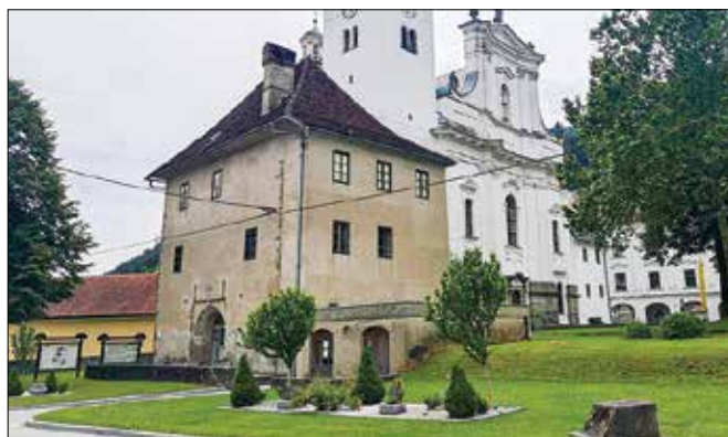
V začetni fazi bo prenovljen Štekl, streha in notranjost pritličja z galerijskim prostorom.

Park pred katedralo bo dobil poudarjeno podobo in vsestran-