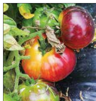
Antho striped dwarf

cah, seminarjih in predavanjih širom po Sloveniji. V zadnjem času je strokovni vodja projekta ocvetličanja velenjske mestne četrti Levi breg, kjer želijo ozavestiti in spodbuditi ljudi k temu, da svoje balkone in okenske police okrasijo s cvetjem, zelenjavo ali zelišči. Poleg tega sodeluje z revijo Rože in vrt, njegove nasvete je moč zaslediti v oddajah Na vrtu na nacionalni televiziji in Dobro Jutro na VTV Velenje.