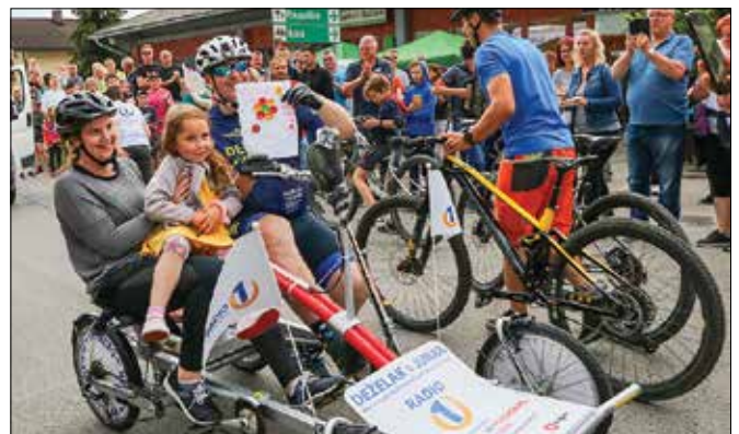
Ljudje se že marsikje družijo.

Od ponedeljka, 15. junija, je dovoljeno zbiranje do 500 oseb na javnih krajih in mestih, tudi na športnih prireditvah, sproščen je javni prevoz potnikov v mednarodnem prometu. To pomeni, da se