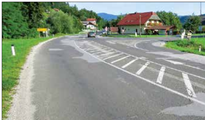
V najboljšem primeru bi z deli za krožišče v Radmirju lahko pričeli v letu dni.

Po besedah župana Naraločnika je občina pridobila vsa so-