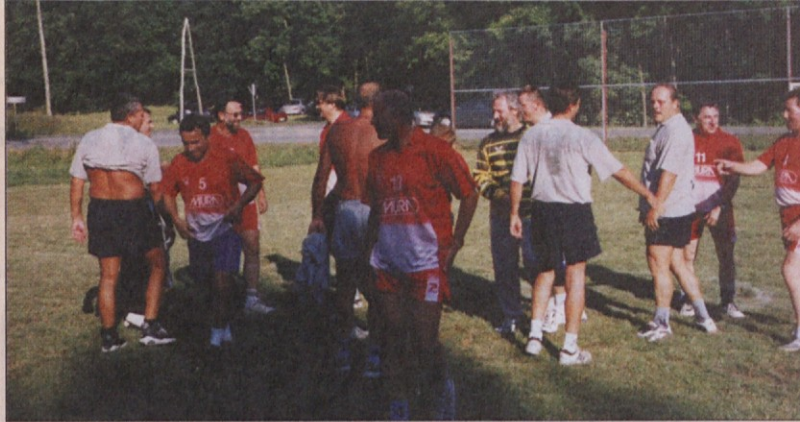
Gledalci so spremljali zanimivo igro in lep nogomet.