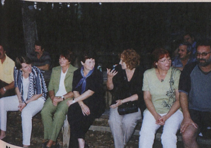
Na srečanju je bilo toliko simpatičnih udeleženk, da žirija za izbiro mis ni imela lahkega dela.