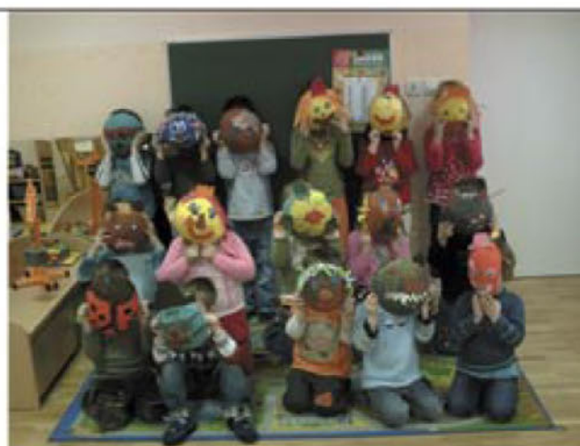
Izdelovanje pustnih mask