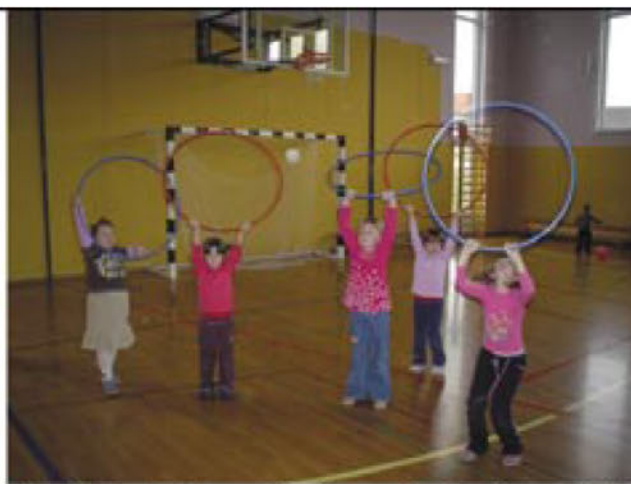
Gibalne aktivnosti s športnimi pripomočki