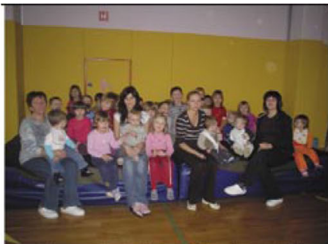
Skupno druženje v šolski telovadnici

Zima je skozi dejavnosti ter aktivnosti, ki smo jih pripravili v vrtcu hitro minila in nekaj utrinkov je prikazanih na fotografijah: