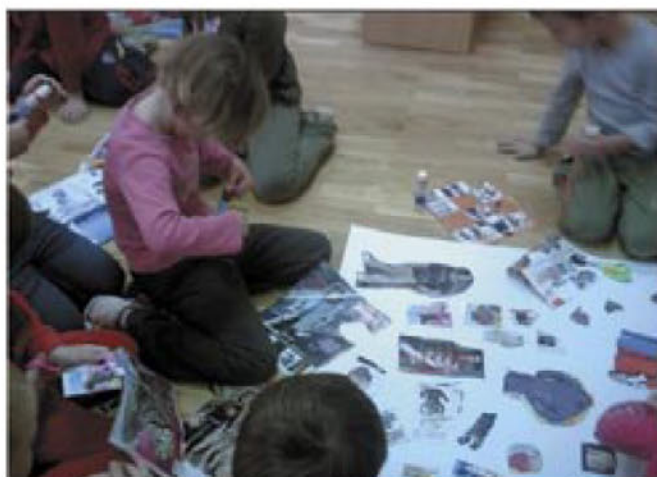
Dejavnosti, ki so potekale na temo zima