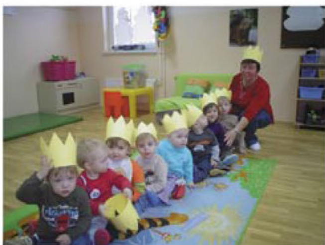
Naša skupna pustna preobrazba