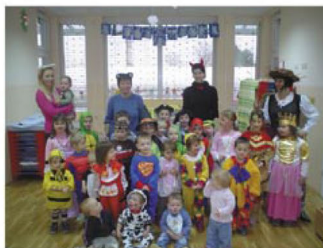
Veselo pustno rajanje v vrtcu