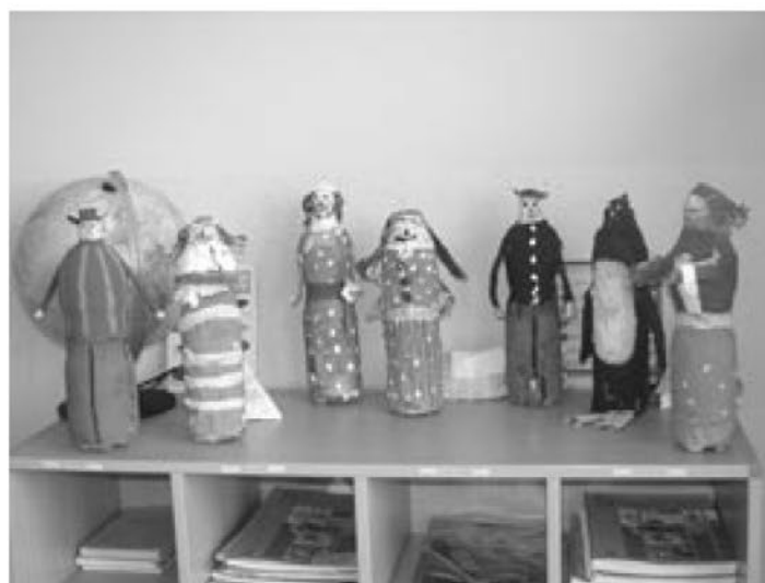
Izdelki učencev učiteljice Angele