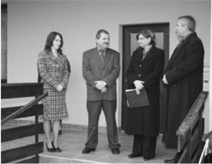
Slovesne otvoritve enote se je udeležila tudi ministrica za delo, družino in socialne zadeve Marjeta Cotman (druga z desne)

Bivša osnovna šola Trnovska vas, ki je postala za naše devetletkarje že pretesna, je decembra lanskega leta ponovno zaživela. Velikodušno je namreč ponudila streho nad glavo novim stanovalcem. Pa ne samo streho, prenovljena in sodobno preurejena je postala topel dom 22 članom bivalne enote Zavoda Hrastovec-Trate.