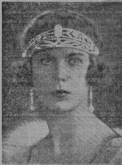
Marijo Jose, italijansko princesinjo, je imenoval Mussolini za nadzornico onih usmiljenih sester, katere so se priključile Rdečemu križu