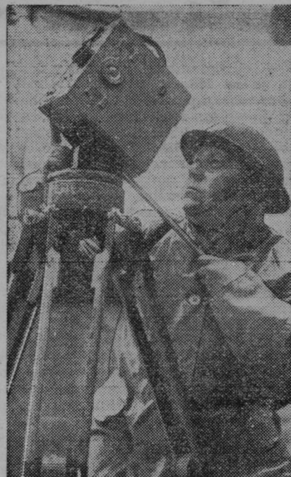
Vojni kino-operator snema prizore iz zračne borbe

se mu je poskušal izogniti, a je pri tem zavezil v škarpo, radi česar se je avto občutno poškodoval. Škode je okrog 6000 din.