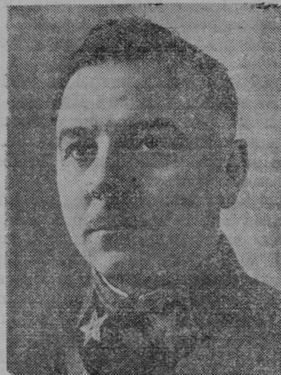
Maršal Vorošilov, vrhovni poveljnik sovjetske vojske