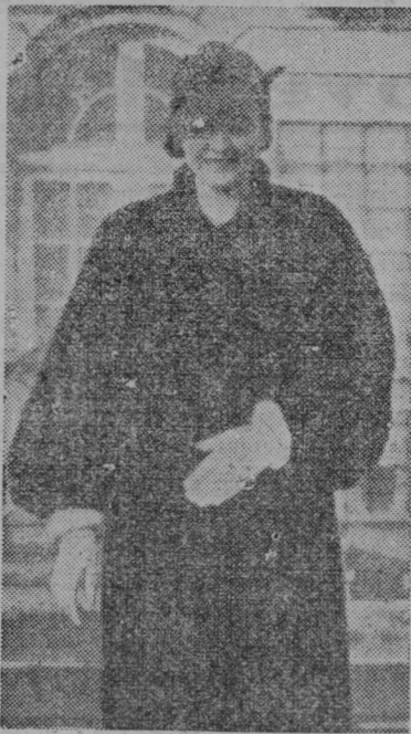
Gospa Marta Smigly Rydz, soproga poljskega maršala