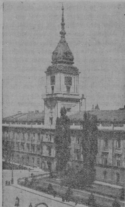
Stari grad v Varšavi, v katerem je bil nastanjen predsednik poljske republike Mosaiccki