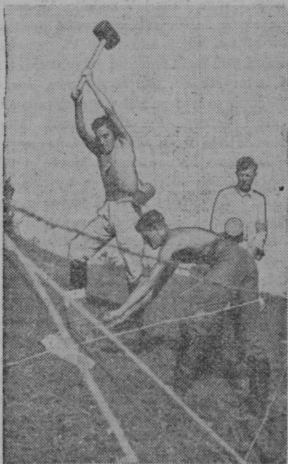
Za nemškimi četami so prišli v poljsko zasedeno ozemlje nemški delavci, kateri popravljajo vojno škodo in odstranjujejo žične ovire.