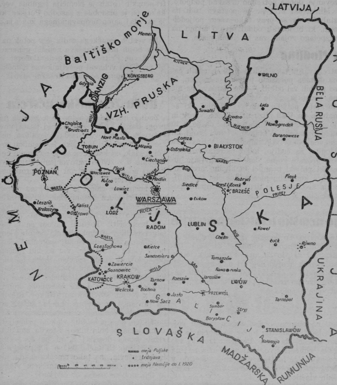
Zemljevid Poljske z označbo mest in rek, za kojih posest so se bili v zadnjih 14 dneh najbolj srditi boji. S pikami zaznamovano ozemlje je pripadlo Poljski leta 1920 po verzajski mirovni pogodbi na račun Nemčije

Nemci pripisujejo že končanem bojem okrog Gdanska, kjer se je peščica poljske posadke na Westerplatte tako vztrajno borila z nemško vsestransko premočjo, ve-