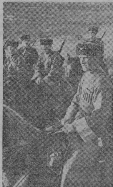
Sovjetska konjenica — Kozaki