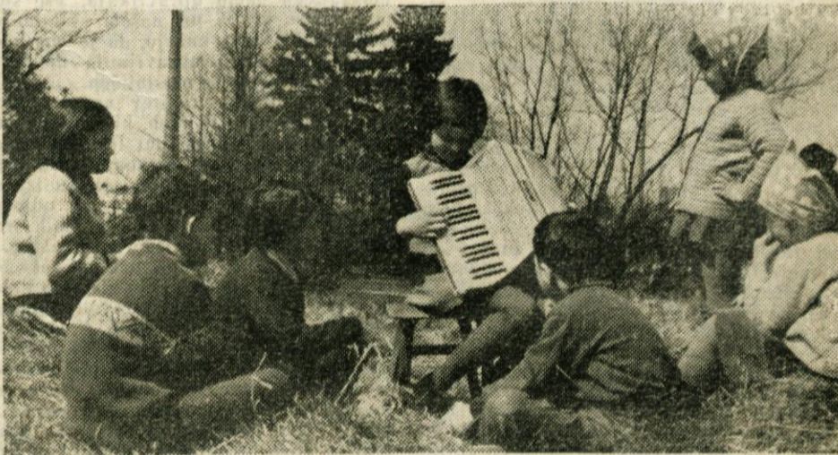
Mladina čestita za praznik dela — 1. maj delovnim ljudem vsega sveta!

Številna podjetja bodo prodajala svoje izdelke po izrednih — znižanih cenah.