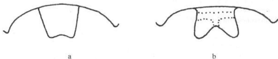
Fig. 2: Labrum-appendage of Andrena saxonica (a) and Andrena krasensis (b).

The name of the new species is derived from the name of the region where it was found – Kras (Karst).