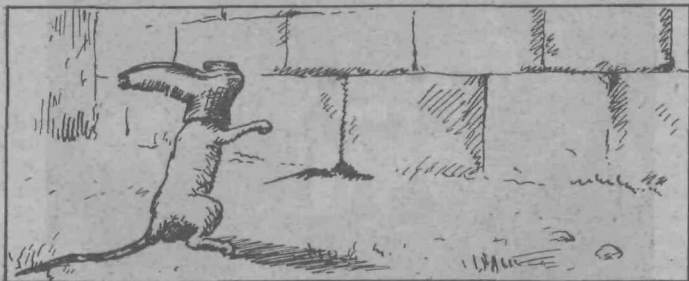
3. Pa ne tako.