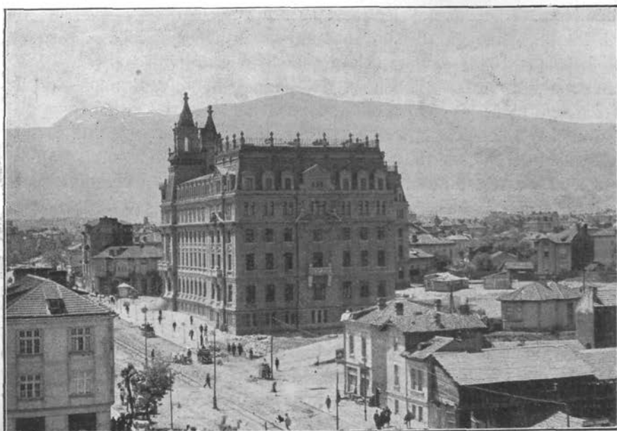
Sofija z Vitošo Planino

ozkega pasu nove grške zemlje, kjer je ostalo še toliko slovanskega življa, proti Egejskemu morju, potem ko napolni poprej še veliko Tahinsko jezero. Tam v ozadju za Vitošo se skriva začaran visokogorski svet veličastne Rile Planine in neizmerno, samotno gorsko kraljestvo skrivnostnega Pirina. Tu je sveti hram bolgarskega gorskega sveta, tu so postavljeni tihi oltarji bolgarskega planinstva in njegovih vernih apostolov in svečnikov... Pirin in Rila — to sta besedi, pri katerih zadržti duša in srce bolgarskega planinca, ki se mu hoče veličastja samote in miru in novih dognanj. Gori pri sed-