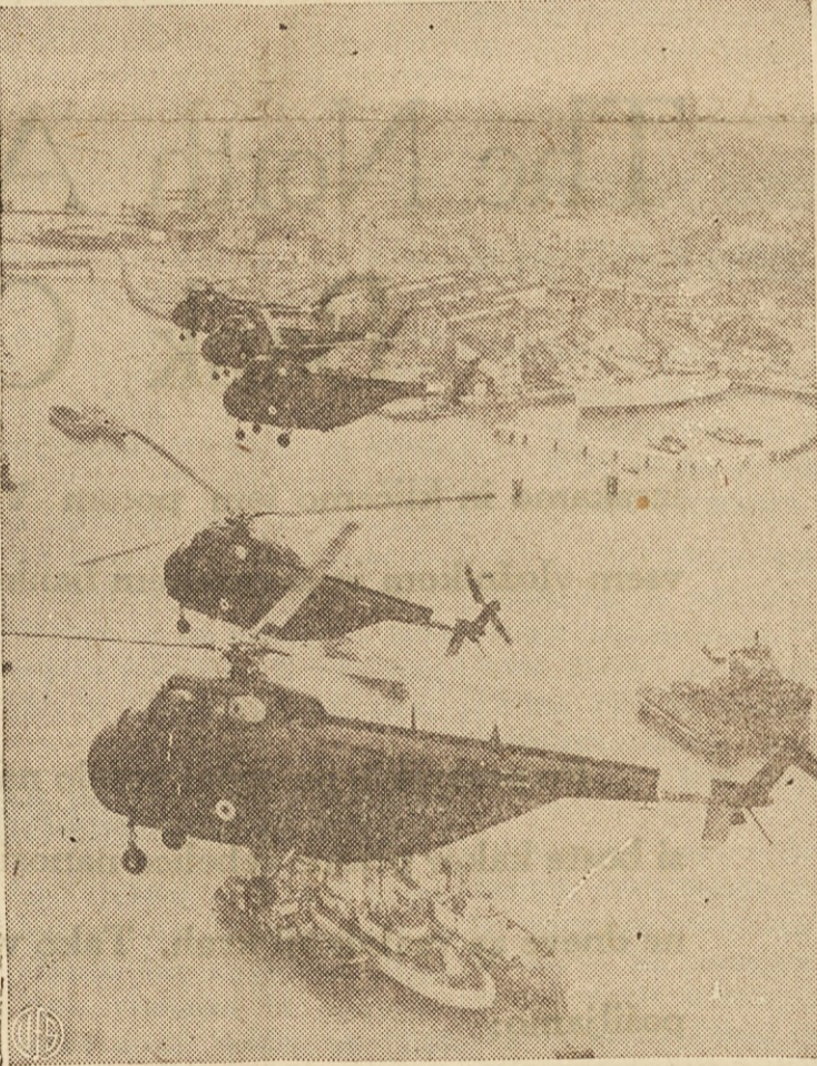
LOVCI NA PODMORNICE — Skupina helikoptrov v poletu nad Solent River pri Gosport na Angleškem. Angleška mornarica je naročila ta Sikorsky letala v Ameriki in jih namerava uporabiti za borbo proti podmornicam.

— Gladina Mišiganskega jezera je za 21 čevljev nižja od gladine Gornjega jezera.