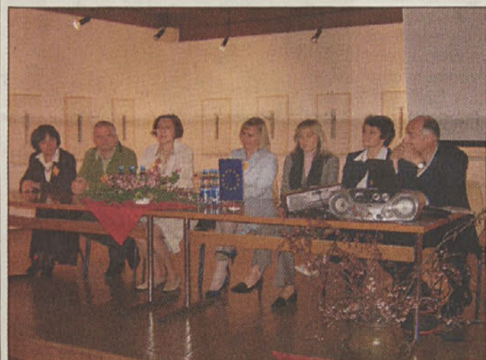
Strokovnjaki so spregovorili o prenovi šolstva.

Kostanjevica na Krki - V Lamutovem likovnem salonu je bila pretekli torek mednarodna konferenca o slovenskem in hrvaškem izobraževalnem sistemu. Konferenca je potekala v okviru programa INTERREG III A "Znanje ne pozna meja", v katerem sodelujejo osnovne šole Jožeta Gorjupa Kostanjevica na Krki, Podbočje, Cerklje ob Krki, Velika Dolina in Milana Langa iz Bregane. Na srečanje so bili povabljeni ravnatelji in svetovalni delavci osnovnih in srednjih šol, predstavniki višješolskih zavodov in lokalne skupnosti.