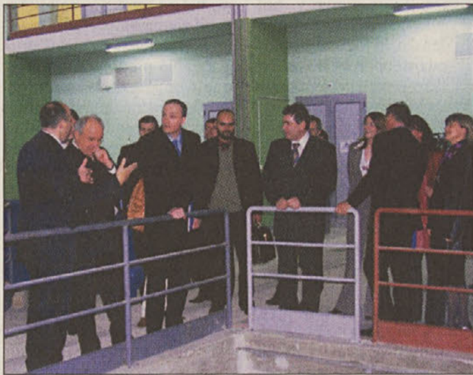
Ministri na ogledu hidroelektrarne

činski svet ob sprejemu dopolnjenega predloga DLN za HE Blanca, sprejel še t.i. uredbo 2, v kateri je občina zahtevala, da se ob gradnji HE Blanca postorijo še nekatere dodatne zadeve, ki so bile zaradi rezervacije prostora dolga