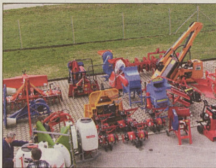
INO predstavlja vedno bolj kakovostne stroje.

ko na države nekdanje Jugoslavije zaradi skromne kupne moči še ne računajo. Seveda pa se bodo še naprej udeleževali sejmov doma in na tujem, kjer so doslej prejeli že celo vrsto odličij. V.P.