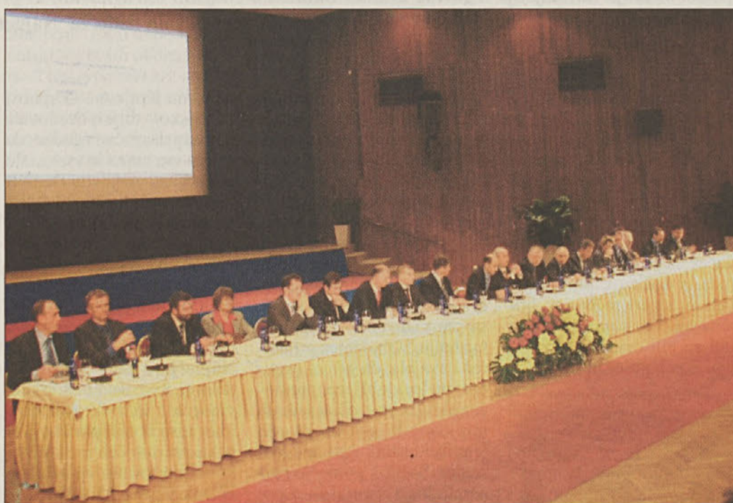
Ministrski zbor v Kulturnem domu Krško

gradnja preostalih elektrarn na Savi in da so razrešeni zapleti okrog financiranja infrastrukturnih objektov, saj gre za nacionalni projekt, ki sodi tudi med večje energetske naložbe v Evropi. Minister za promet Božič je zbranim sporočil, da bo do leta 2008 dokončanih še preostalih 29 km dolenskega kraka avtoceste, da je mogoče pričakovati plovnost okrog 20 km reke Save z rečnima pristaniščema pri Brežicah in pred mejo s Hrvaško, preko Posavja pa bo v prihodnjih letih tekel tudi odsek 135 km dolge tretje prometne osi od avstrijske meje do Bele Krajine. Okrog 1700 upokojencem, ki so si pokojnino