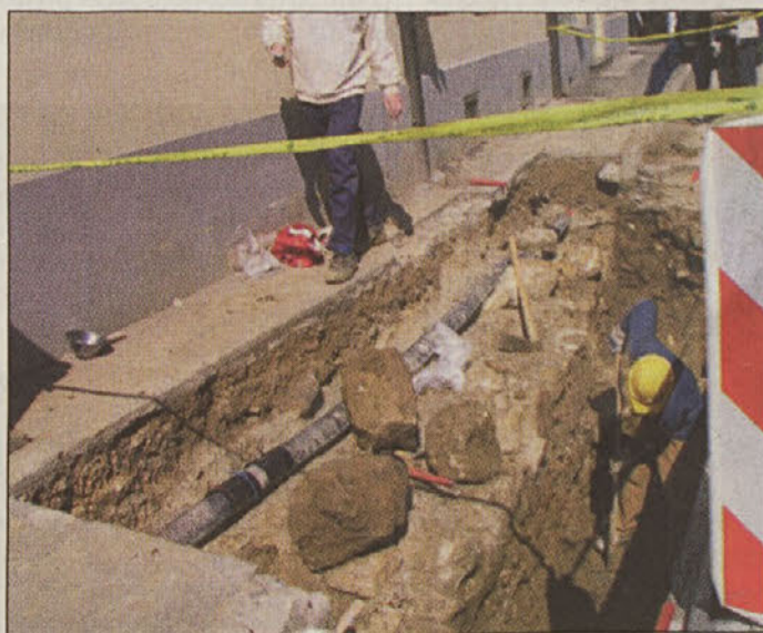
Tu so bila severna brežiška vrata.