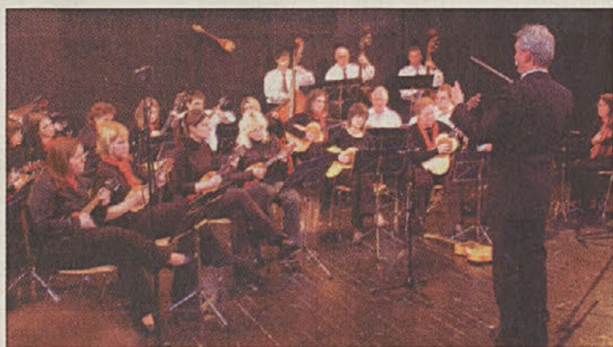
Tamburaški orkester KUD Oton Župančič Artiče